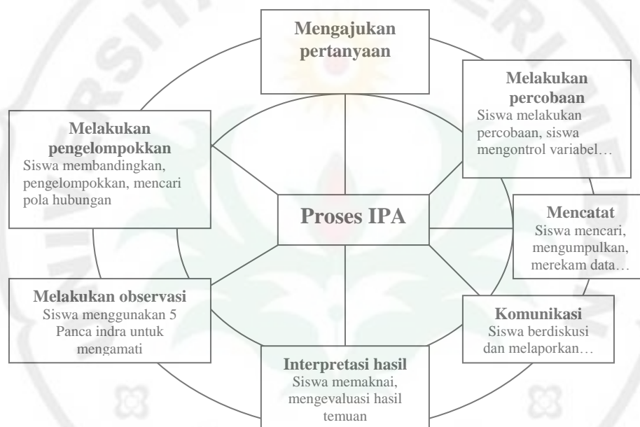
Gambar 1. Bagan Proses Pembelajaran IPA (Sumber: USAID, 2006)

guru membantu siswa menciptakan makna terkait dengan hasil pemecahan masalah yang akan dilaporkan, (4) pengorganisasian laporan (makalah, laporan lisan, model, program komputer, dan lain-lain), dan (5) presentasi. Seluruh kegiatan ini dapat disusun dalam bentuk bagan seperti yang terlihat pada Gambar 2.1.