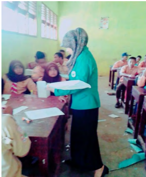
Membagikan angket kepada siswa