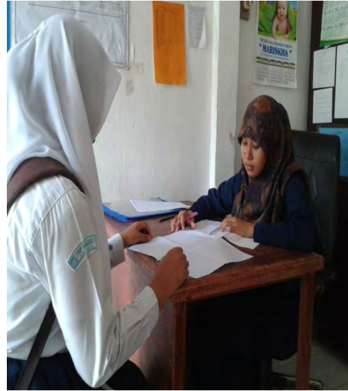
Menjelaskan penggunaan buku harian