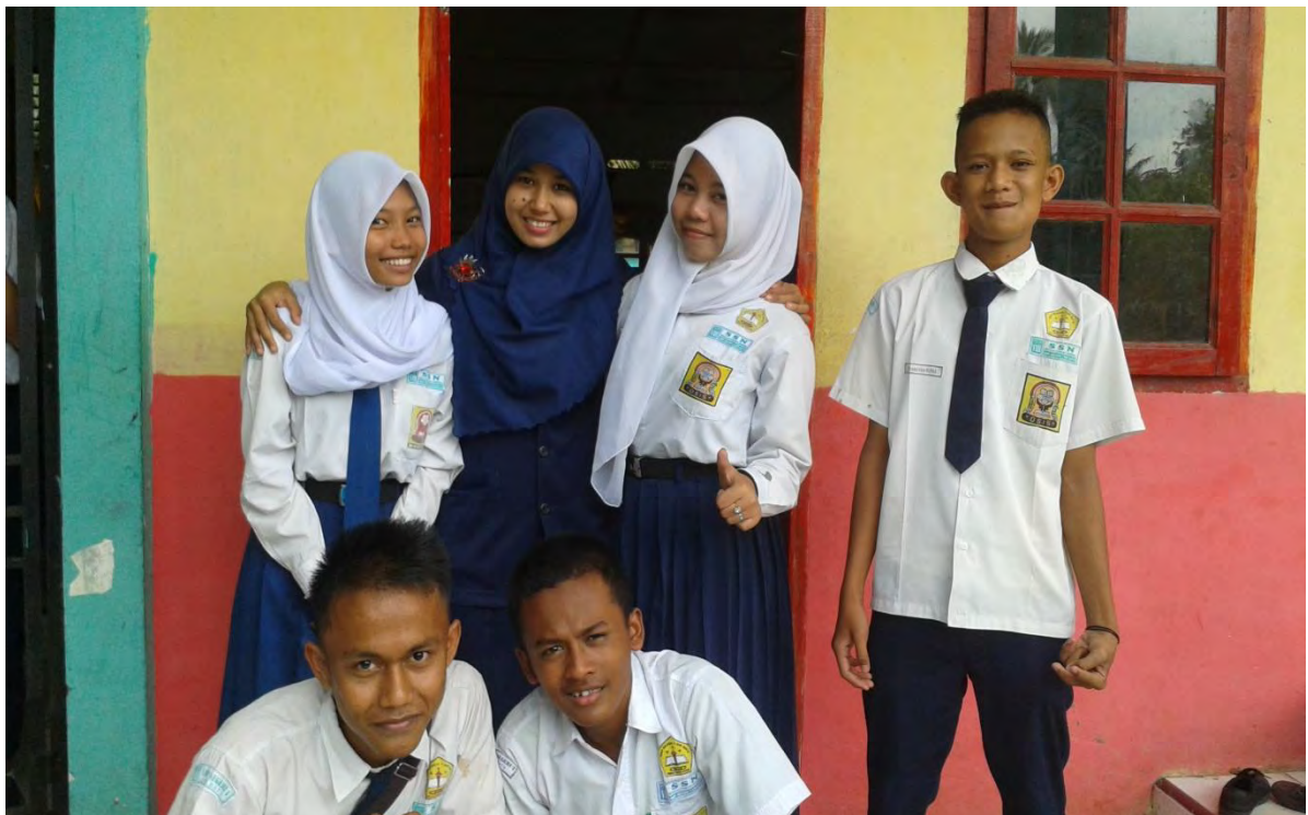
Keakraban yang tercipta antara peneliti dan klien