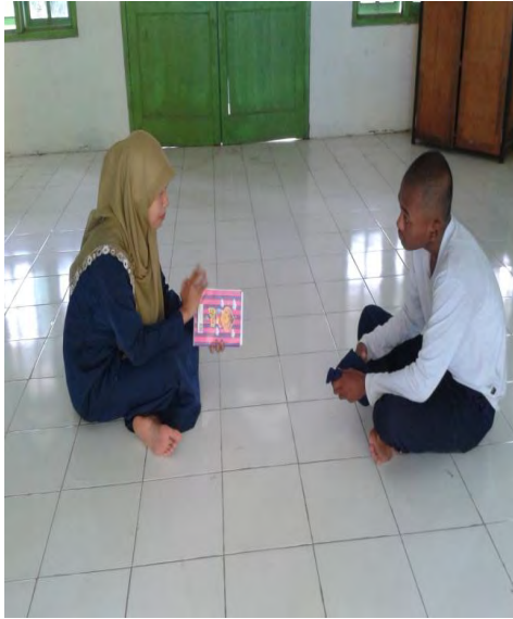
Menjelaskan apa itu Konseling Remaja

3. Melakukan konseling remaja melalui strategi perilaku kognitif.