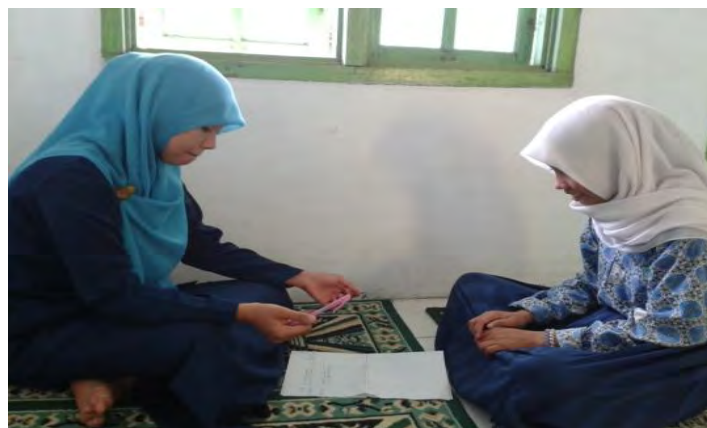
Mengevaluasi buku harian