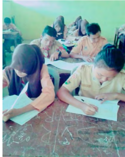
Siswa mengisi angket