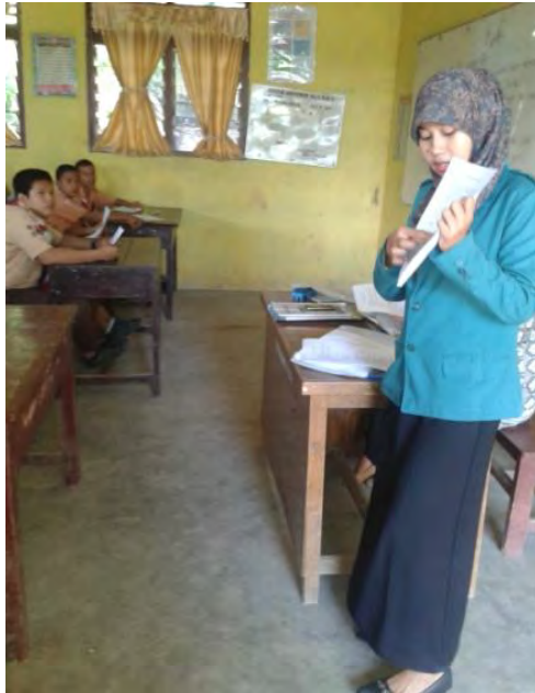
Menjelaskan cara pengisian angket