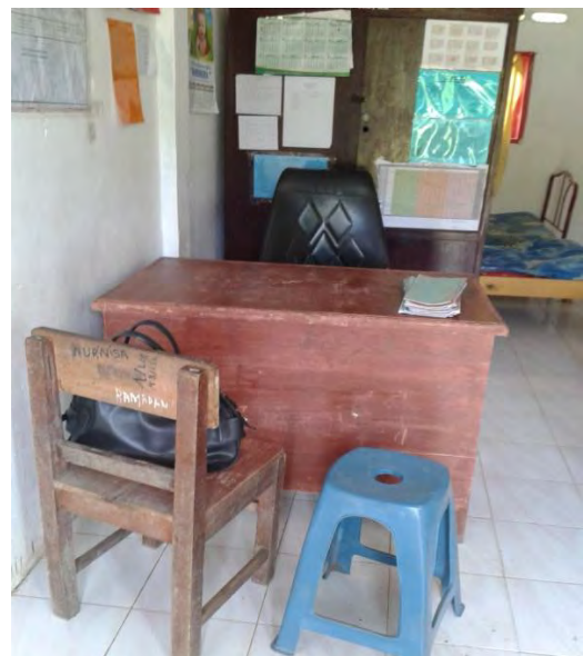
RUANG BK SMP NEGERI 1 AIR BATU