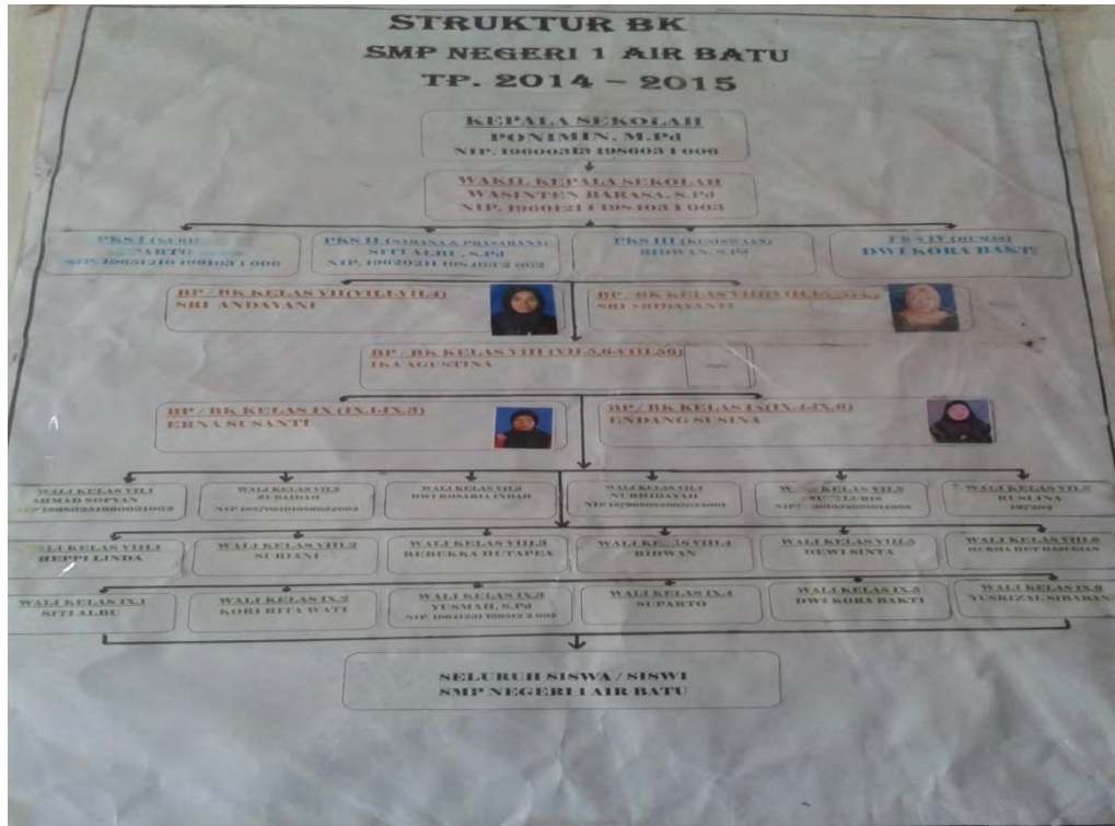
STRUKTUR BK SMP NEGERI 1 AIR BATU T.A 2014-2015