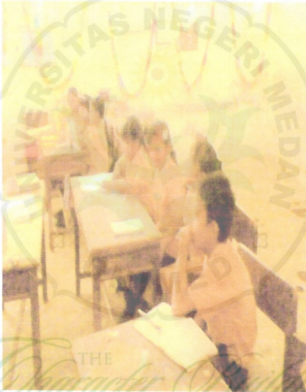
Gambar 6 : peneliti dan siswa menyimpulkan materi pelajaran