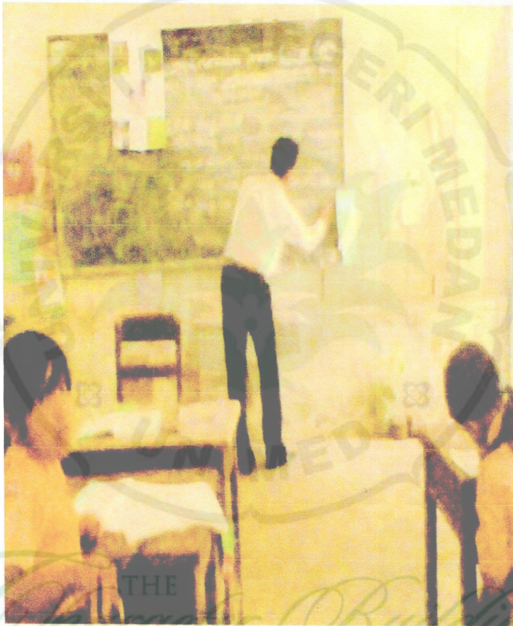
Gambar 2 : peneliti sedang menuliskan Judul dan materi pembelajaran