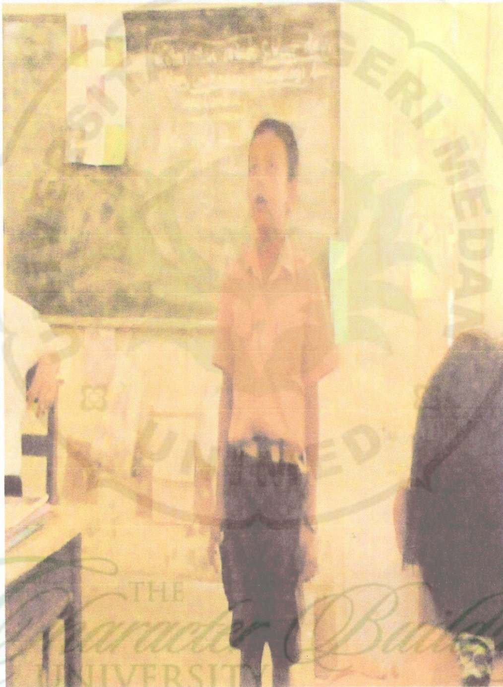
Gambar 4: peneliti menyuruh salah satu siswa menyebutkan contoh dari materi pelajaran