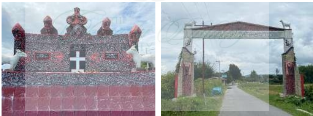
Gambar 9. Gapura Desa Ompu Raja Hatulian & Tugu Ompu Raja Hatulian (Dokumentasi Pribadi, 2025)