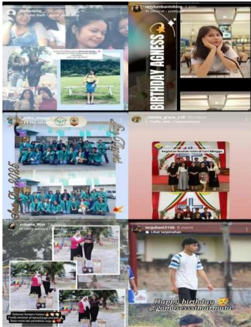
Gambar 3. Bukti beberapa postingan para informan pada akun pertamanya