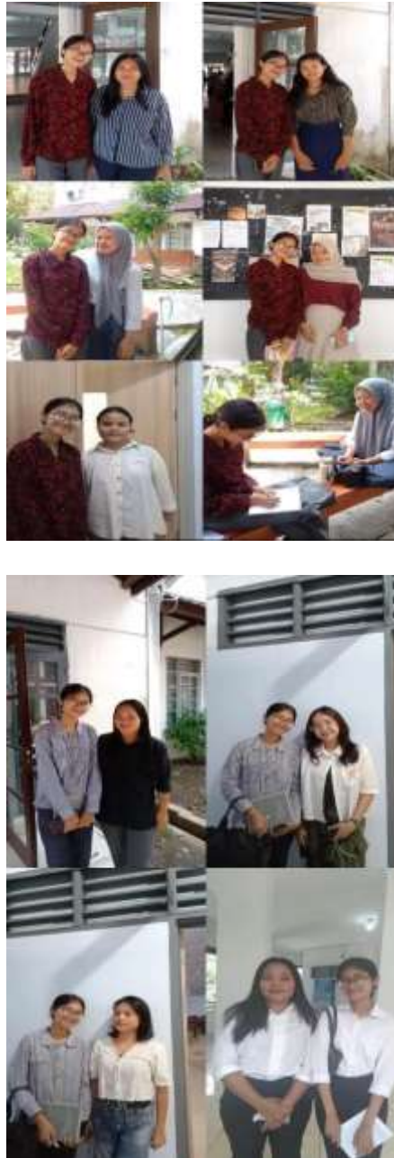
Gambar 1. Bukti Wawancara Offline dengan informan