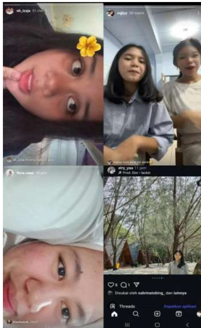
Gambar 4. Bukti beberapa postingan para informan pada akun keduanya