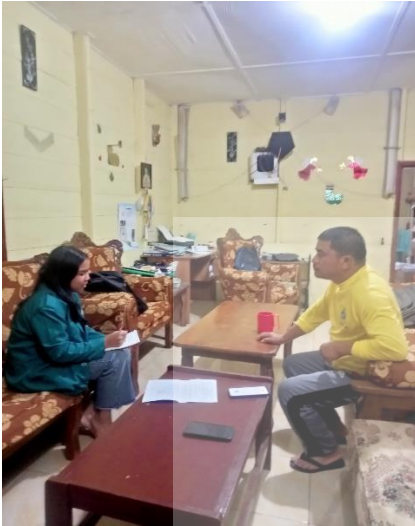
Wawancara dengan Bapak Australia Boangmanalu dokumentasi penelitian tanggal 20 januari 2025