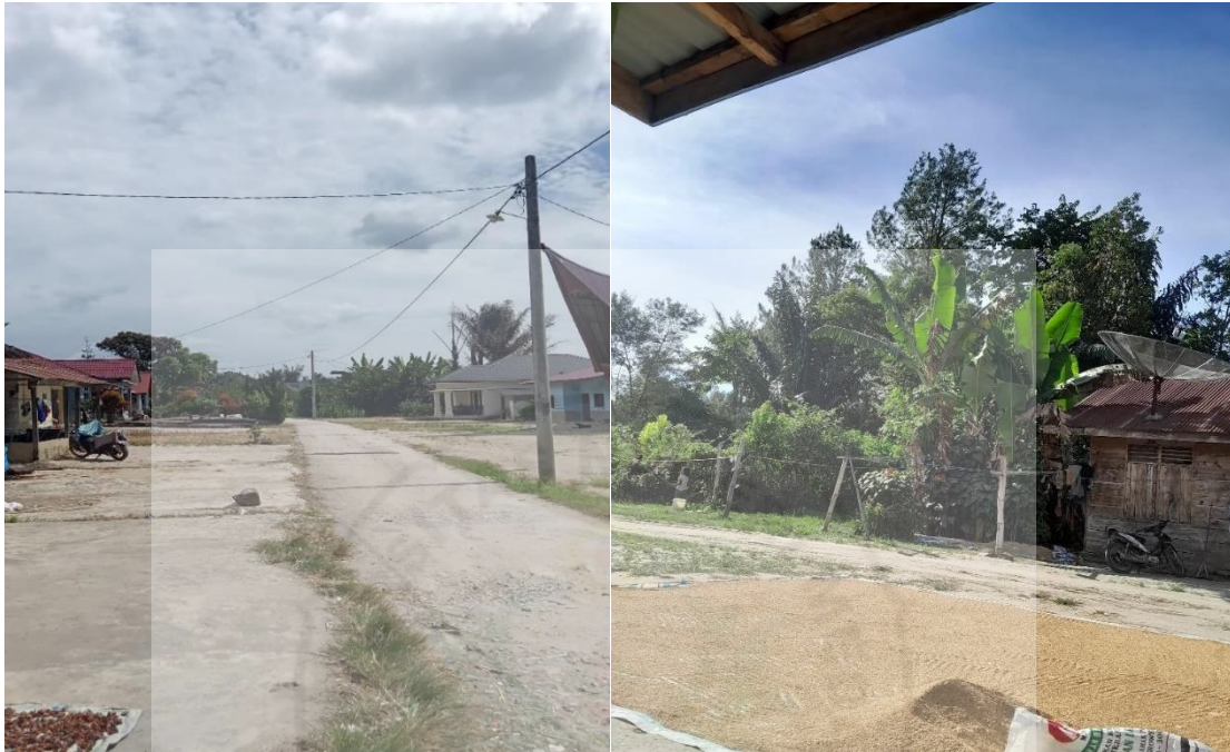
Dokumentasi wilayah Desa Ujung Tanduk