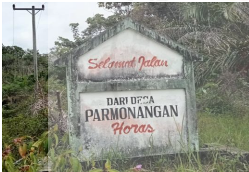
Foto Batu Selamat Datang Desa Parmonangan