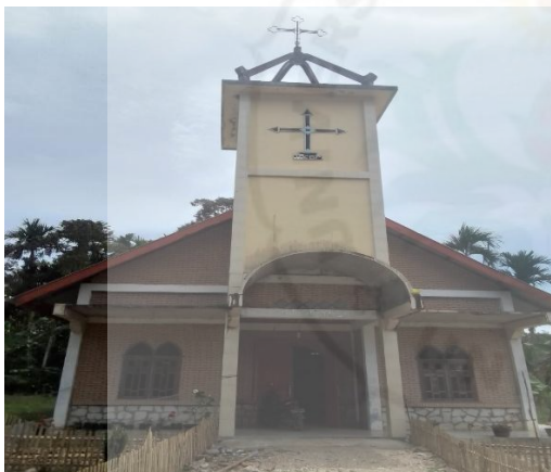
Foto Gereja HKBP desa Parmonangan