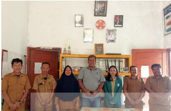
Foto Bersama Kepala Desa dan Staff Desa