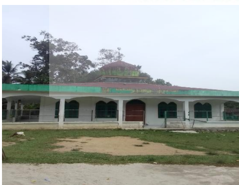
Foto Masjid Desa Parmonangan