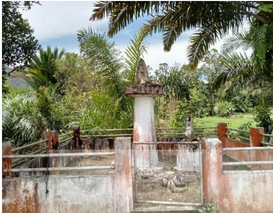
Foto Batu Guru Mandele & terdapat Pandahan dan barang atau makanan Pemberian Penziarah