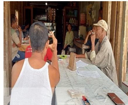
Foto Bersama warga yang sedang berbincang mengenai leluhur di sebuah warung