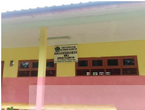
Foto Sekolah MIN di Desa Parmonangan