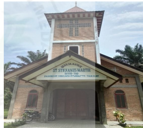
Foto Gereja Khatolik Desa Parmonangan