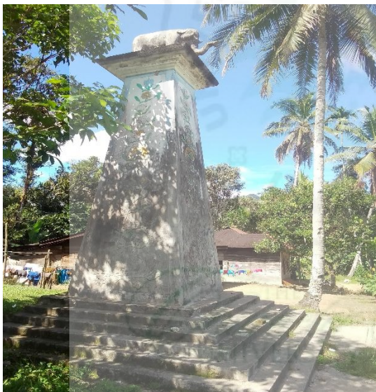
Foto Batu Gajah peninggalan bersejarah di Desa Parmonangan yang pernah dicuri