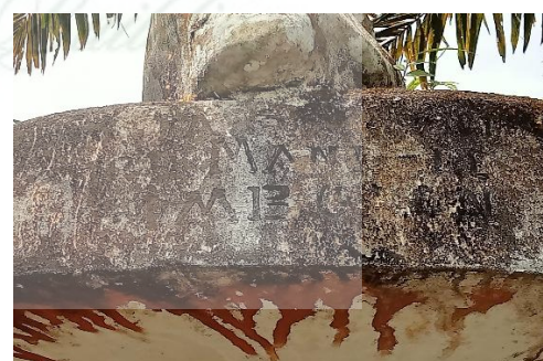
Foto tulisan yang sudah tidak jelas diatas Tugu Batu Guru Mandel