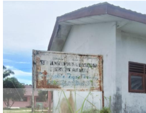
Foto Sekolah SMP 7 & SD negeri di Desa Parmonangan (SDN satu Gedung dengan SMPN 7)