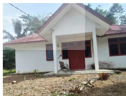
Foto Puskesmas Desa Parmonangan