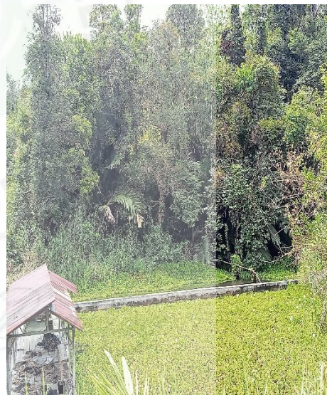
Foto aliran air & tambak yang dibangun semasa pengangkatan Batu Guru Mandele