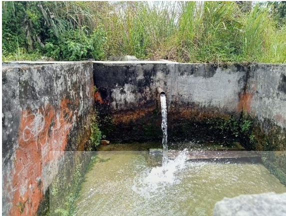
Foto pancuran aek Sitio-tio di Desa Parmonangan