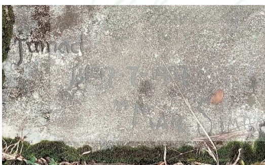
Foto sebuah tulisan dibawah Tugu Batu Guru Mandele yang menjelaskan hari dan tanggal Batu diangkat