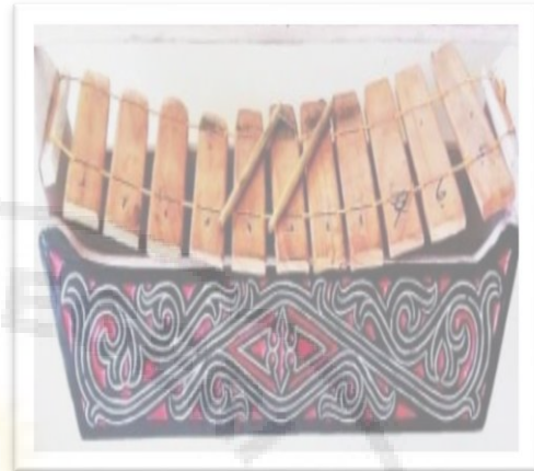
Alat Musik Garantung