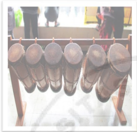
Alat Musik Tradisional : Taganing