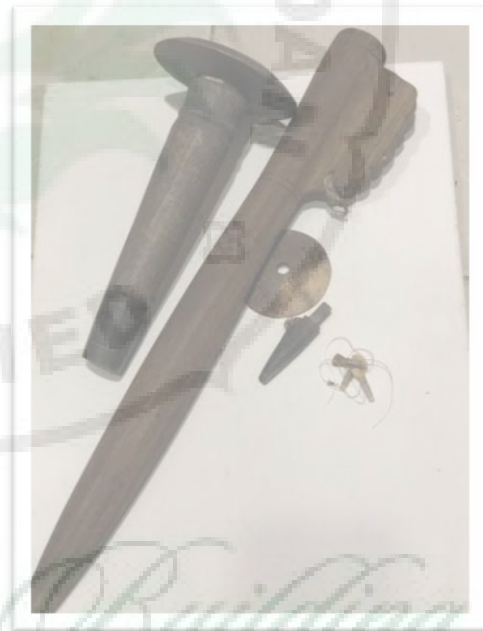
Alat Musik Sarune