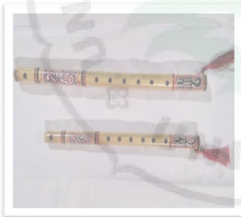
Alat Musik Tradisional Sulim