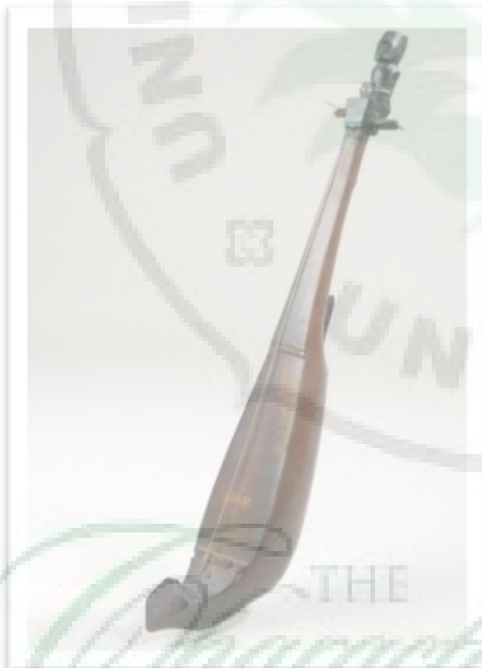
Alat Musik Tradisional Hasapi