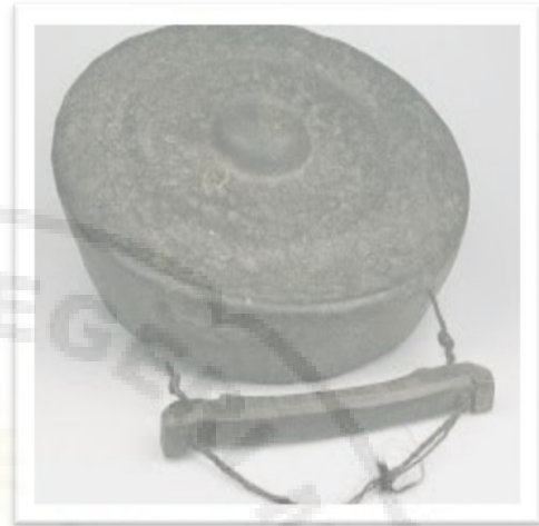
Alat Musik Ogung