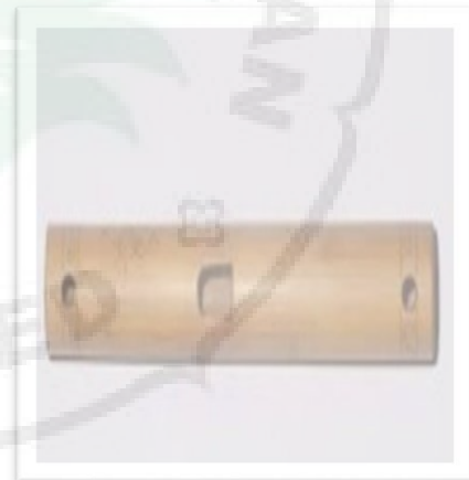
Alat Musik Tulila