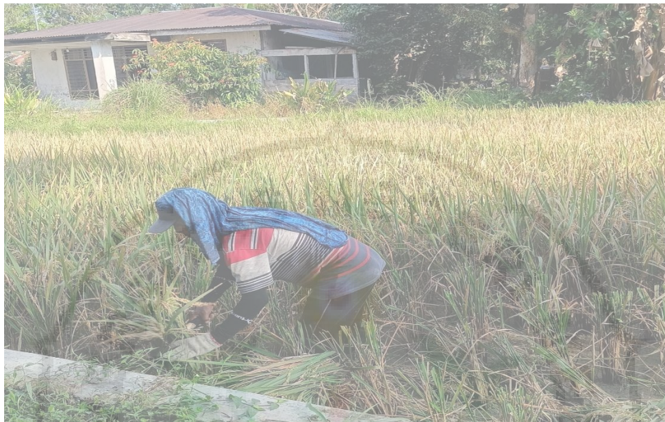
Gambar 3. Buruh tani Sedang Memotong padi di Desa Ujung Rambung