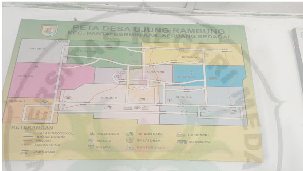
Gambar 1. Peta Desa Ujung Rambung