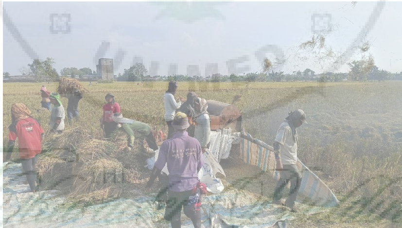
Gambar 6. Para buruh tani saling bergotong royong dan bekerja sama dalam pemanenan padi. Mulai dari membawa tumpukan padi menuju ke mesin perontok, memasukkan padi ke dalam mesin Grendel (perontok padi) dan memasukkan bulir padi kedalam karung.