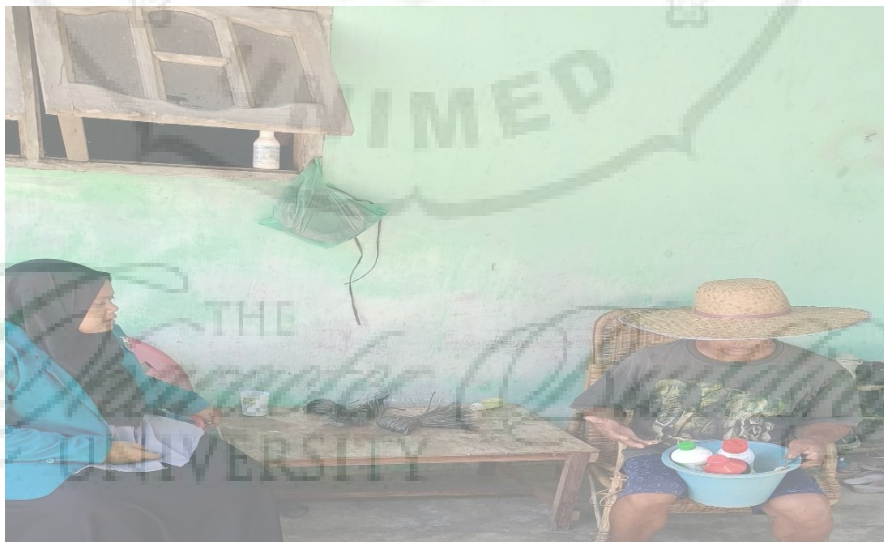
Gambar 11. Dokumentasi wawancara dengan Bapak Sudiongko