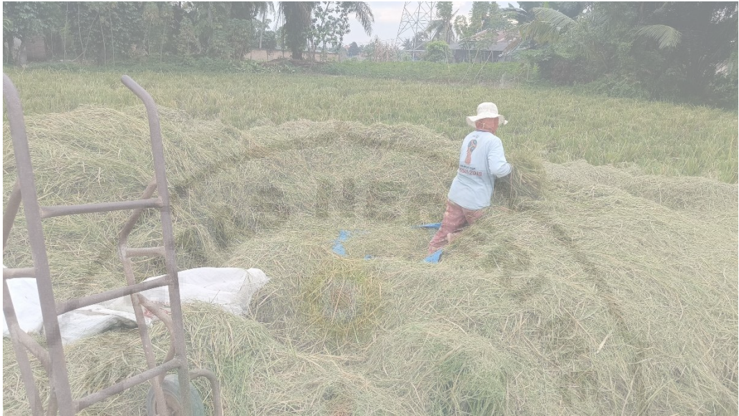
Gambar 7. Ibu Satik sedang mengais padi dari sisa tumpukan jerami hasil perontokan mesin padi