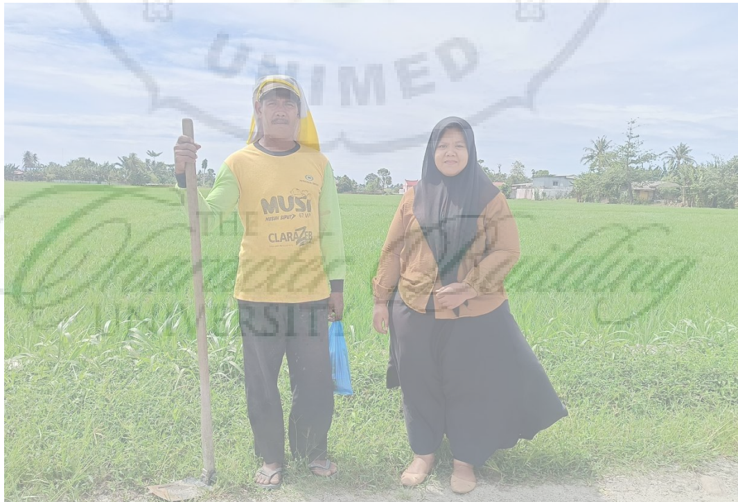
Gambar 13. Foto Bersama dengan Bapak Cariwan