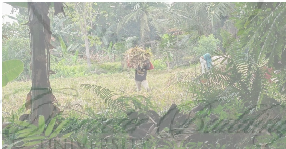
Gambar 4. Buruh Tani Memawa Tumpukan Padi menuju Mesin Perontok Padi