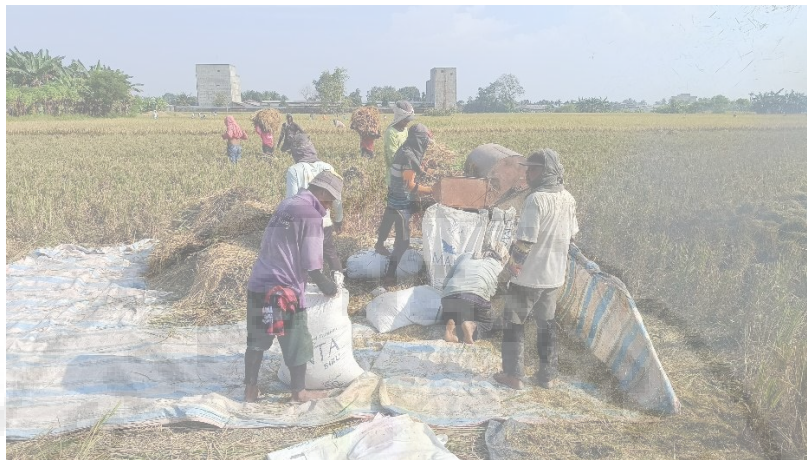
Gambar 5. Para buruh tani saling bergotong royong dan bekerja sama dalam pemanenan padi. Mulai dari membawa tumpukan padi menuju ke mesin perontok, memasukkan padi ke dalam mesin Grendel (perontok padi) dan memasukkan bulir padi kedalam karung.