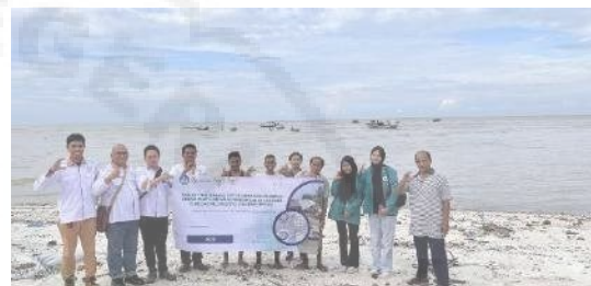
Gambar 10. Serah Terima Pekerjaan

Setelah pembangunan selesai, dilakukan monitoring setiap bulan untuk mengevaluasi kinerja tanggul, terutama pada musim gelombang pasang. Tim pengabdian juga mendampingi masyarakat dalam melakukan perawatan sederhana, misalnya memperkuat modul yang bergeser atau mengisi rongga dengan batu tambahan.