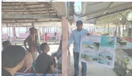
Gambar 8. Sosialisasi dengan Masyarakat

Kegiatan ini memperkuat kesadaran bahwa abrasi bukan hanya masalah pemerintah, tetapi tanggung jawab kolektif warga.