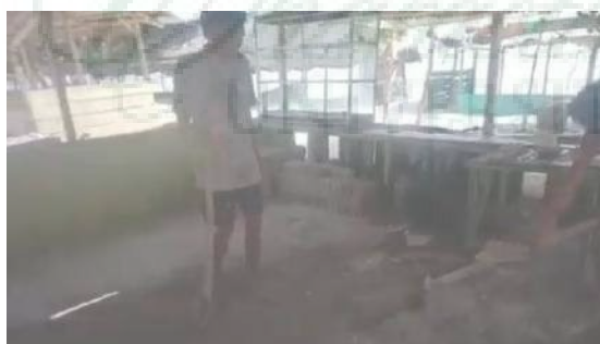
Gambar 10. Pembangunan Fisik

Proses pembangunan dilaksanakan secara gotong royong selama 12 hari kerja efektif. Sekitar 30 orang warga terlibat aktif dalam penyusunan modul beton sepanjang garis pantai yang kritis.