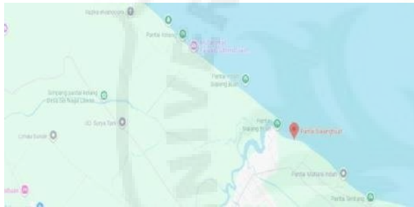
Gambar 3. Lokasi Pengabdian

Program pengabdian ini dilaksanakan di Desa Sialang Buah, Kecamatan Teluk Mengkudu, Kabupaten Serdang Bedagai, Sumatera Utara. Lokasi ini dipilih karena tingkat abrasi yang cukup tinggi (mundurnya garis pantai ±5 meter dalam 3 tahun terakhir). Selain itu, kawasan ini memiliki potensi wisata bahari yang besar, tetapi terganggu akibat kerusakan fasilitas wisata dan ancaman terhadap rumah warga.