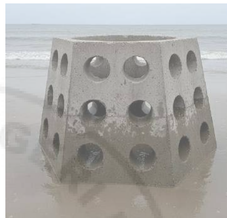
Gambar11. Bentuk Fisik Tanggul