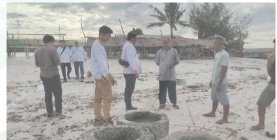
Gambar 4. koordinasi dengan Pokdarwis

Dalam program ini, Pokdarwis diberdayakan bukan hanya sebagai penerima manfaat, melainkan juga sebagai koordinator lapangan. Mereka dilibatkan sejak tahap awal, mulai dari survei lokasi, pengambilan keputusan titik pemasangan tanggul, hingga koordinasi gotong royong. Peran ini membuat Pokdarwis semakin memiliki kapasitas teknis dan manajerial. Dengan bekal ini, mereka tidak hanya bisa mengelola wisata, tetapi juga menjaga keberlanjutan infrastruktur pelindung pantai.