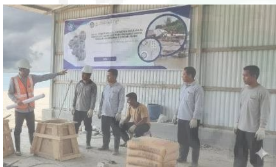
Gambar 9. Pelatihan Pembuatan Tanggul

Pelatihan dilakukan di lapangan, meliputi cara menyusun modul beton, mengikat antar modul, dan memastikan kestabilan tanggul. Pelatihan berbasis praktik lapangan membuat masyarakat tidak hanya sebagai penerima manfaat, tetapi juga sebagai pelaksana.