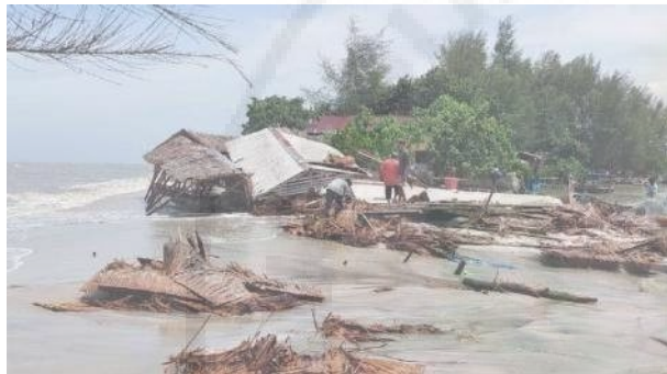
Gambar 1. Kondisi Pantai Pasca Abrasi

Salah satu wilayah yang terdampak abrasi cukup parah adalah Desa Sialang Buah, Kecamatan Teluk Mengkudu, Kabupaten Serdang Bedagai, Sumatera Utara. Fenomena abrasi di Pantai Sialang Buah telah beberapa kali dilaporkan oleh media lokal. Menurut berita yang dimuat Tribun Medan (2024), abrasi telah merusak sejumlah pondok wisata dan mengancam rumah warga di pesisir Kecamatan Teluk Mengkudu. Warga mengaku khawatir karena gelombang pasang semakin sering masuk ke daratan dan menyebabkan kerusakan fasilitas wisata.