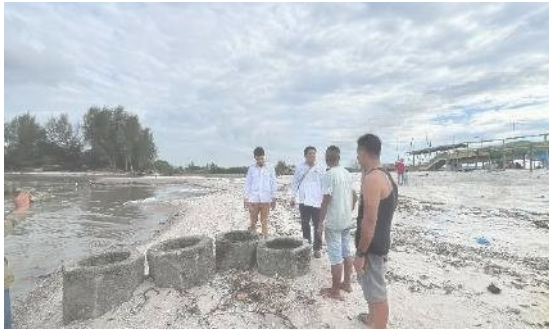
Gambar 5. koordinasi dengan Pemuda Pesisir

yang sebelumnya lebih banyak ditangani generasi tua.