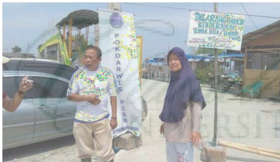
Gambar 6. koordinasi dengan Pemilik Pondok Wisata dan Pedagang Lokal