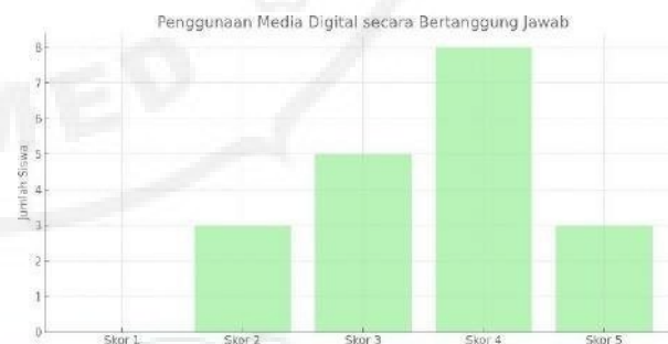
Gambar 2. Penggunaan Media Digital secara Bertanggung Jawab

Pada aspek penggunaan media digital secara bertanggung jawab, mayoritas siswa (42,11%) juga berada pada kategori baik (skor 4), namun masih ditemukan siswa dengan pemahaman rendah sebesar 15,79%. Kondisi ini mengindikasikan bahwa siswa masih memerlukan pendampingan dalam memahami etika, tanggung jawab, dan sikap bijak dalam menggunakan media digital.