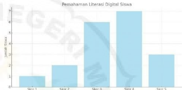
Gambar 1. Tingkat Pemahaman Literasi Digital

Berdasarkan hasil survei awal, tingkat pemahaman literasi digital siswa menunjukkan variasi yang cukup signifikan. Sebagian besar siswa (36,84%) berada pada skor 4 yang menunjukkan kategori baik, namun masih terdapat siswa yang berada pada kategori rendah (skor 1 dan 2) sebesar 15,79%. Hal ini menunjukkan bahwa belum seluruh siswa memiliki pemahaman yang memadai terkait literasi digital.