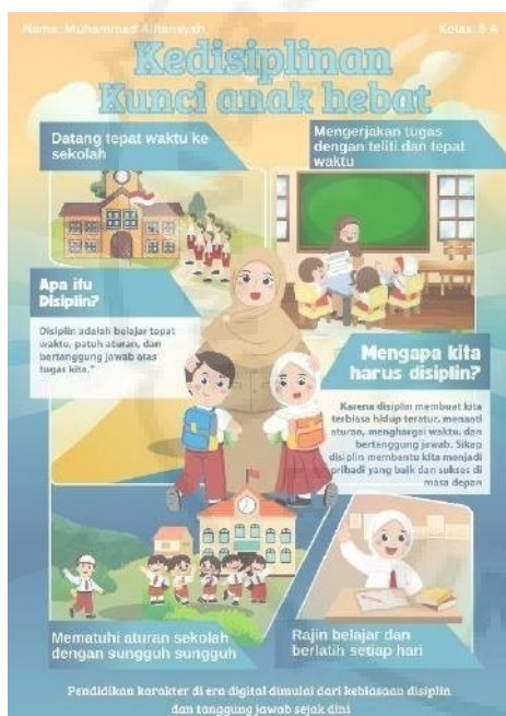
Gambar 4. Contoh Poster Peserta Pelatihan

Setelah pelaksanaan kegiatan pendampingan yang meliputi pemaparan materi literasi digital dan pendidikan karakter, praktik pembuatan poster digital, serta evaluasi dan refleksi, diperoleh hasil yang menunjukkan peningkatan pemahaman dan keterampilan siswa. Salah satu indikator keberhasilan program ini adalah dihasilkannya produk poster digital bermuatan nilai-nilai karakter yang dibuat secara mandiri oleh siswa.