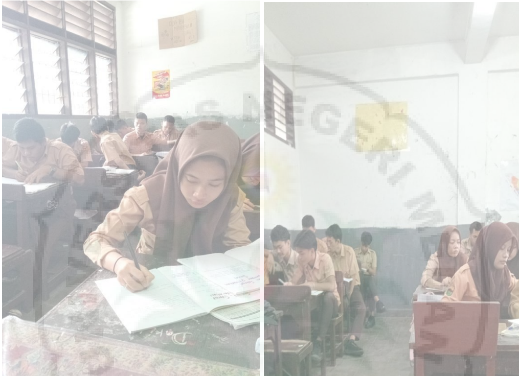
Gambar 2.1 Foto observasi melihat interaksi para remaja di dalam kelas