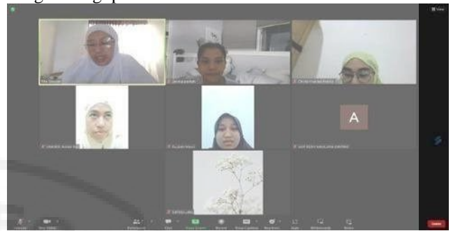
Gambar 1. Kegiatan Zoom Tim PKM Unimed tanggal 3 Mei 2025

produksi sabun cair/bulannya. Tujuan perlu ditetapkan analisis kebutuhan agar kegiatan tepat guna bagi pihak sekolah.