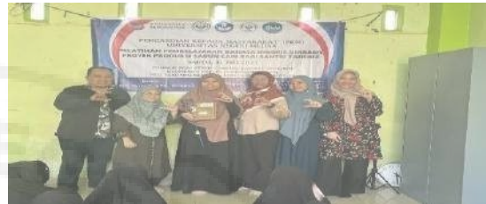
Gambar 6. Penyerahan Alat Praktek Pembuatan Sabun Cair

diakhiri dengan penyerahan alat untuk proses pembuatan sabun cair kedepannya. Dengan alat dan video proses pembuatan sabun cair, diharapkan pihak ponpes Tahfidz Baitusy Syakirin dapat menghasilkan produk sabun cair yang bukan hanya berguna untuk kebutuhan sekolah, tetapi dapat menjadi income generate sekolah.