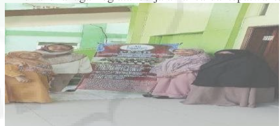
Gambar 2. Pertemuan langsung antara Tim PKM Unimed dan Kasek Ponpes Tahfidz Baitusy Syakirin di bulan April 2025