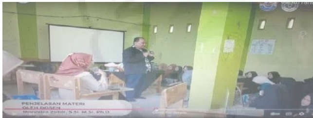
Gambar 4. Penjelasan Bahan Kimia dalam Pelatihan Pembuatan Sabun Cair bagi Santriwati Ponpes Tahfidz Baitusy Syakirin