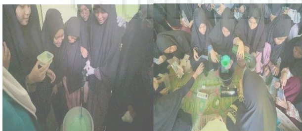
Gambar 5. Pelatihan Pembuatan Sabun Cair oleh Santriwati Ponpes Tahfidz Baitusy Syakirin