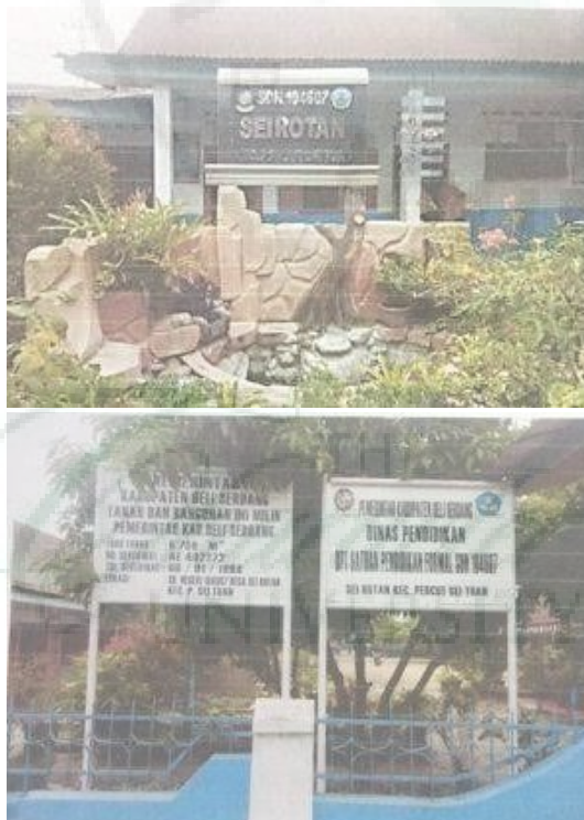
Gambar.1. Lokasi PKM Sekolah Mitra

Mengingat potensi Mitra dalam hal ini upaya untuk Peningkatan Mutu Kualitas Guru Sekolah Dasar Dengan Pemanfaatan Media Pembelajaran Berbasis IT CLASS POINT di SDN 104607 Sei Rotan Kecamatan Percut Sei Tuan Kabupaten Deli Serdang, dapat dilihat pada lokasi mitra gambar.1