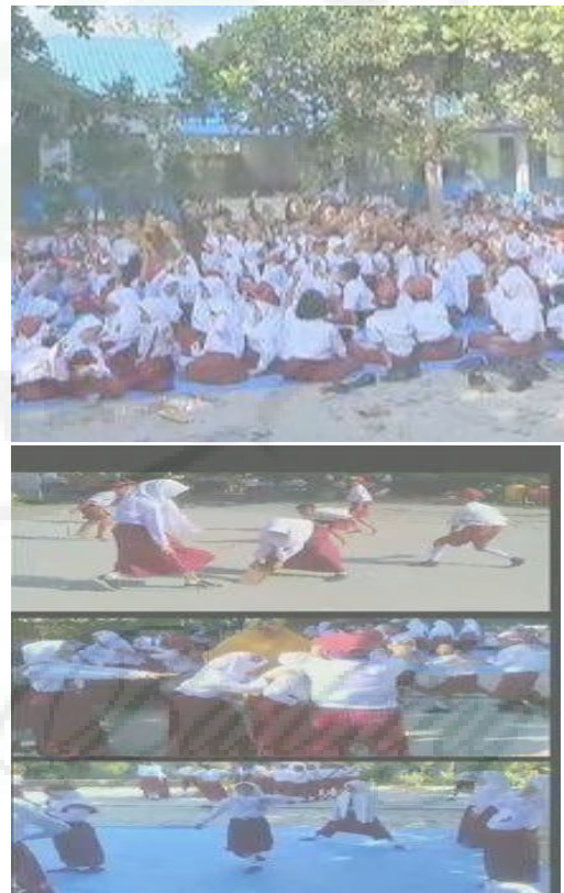
Gambar.2 Suasana Sekolah

Menurut Mitra dalam hal ini guru dan Kepala Sekolah menyatakan bahwa usahanya pembelajaran terus berkembang tetapi terkendala pada media Pembelajaran biasanya guru menggunakan media tradisional atau seperti menggunakan bahan kertas kartun, media bahan langsung dan lain-lain. Dengan demikian dirasa perlu untuk peningkatan kualitas guru melalui Peningkatan Mutu Kualitas Guru Sekolah Dasar Dengan Pemanfaatan Media Pembelajaran Berbasis IT CLASS POINT di SDN 104607 Sei Rotan Kecamatan Percut Sei Tuan Kabupaten Deli Serdang. Sehingga dengan kendala yang dihadapi mitra ini maka dirasa perlu untuk mendesain pembelajaran sesuai apa yang di harapkan, berikut foto kegiatan para perangkat dan suasana sekolah dan dapat terlihat pada gambar. 2