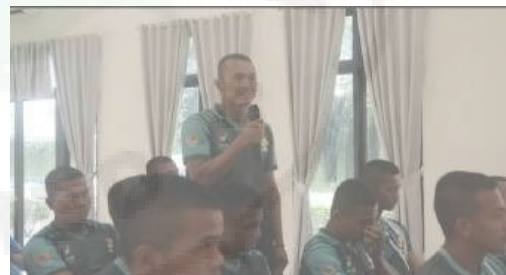
Gambar 8. Tanya Jawab dengan Narasumber