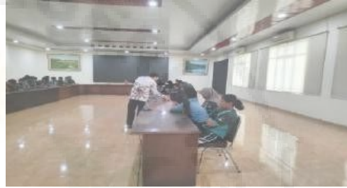
Gambar 13. Tahap Evaluasi

Evaluasi akhir menunjukkan bahwa 85% anggota merasa puas dengan program yang telah dilaksanakan. Data yang dikumpulkan menunjukkan bahwa rata-rata kebugaran fisik atlet meningkat sebesar 20% setelah mengikuti program. Selain itu, tingkat cedera menurun secara signifikan, yang menunjukkan efektivitas program pelatihan dan rehabilitasi yang diterapkan.