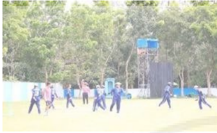
Gambar 9. Tahap Pelatihan 1