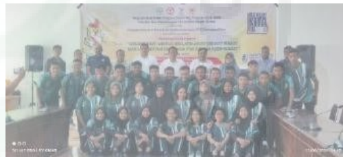
Gambar 14. Foto Bersama Pelaksana, Narasumber, dan Peserta Kegiatan PKM