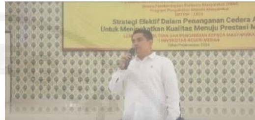
Gambar 6. Kata Sambutan Ketua Pelaksana