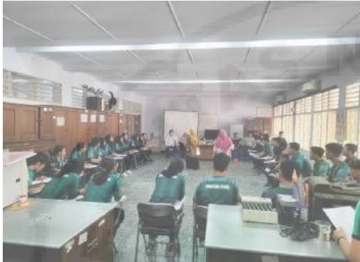
Gambar 3. Identifikasi Kebutuhan

pelatihan yang disusun mencakup teknik pencegahan cedera dan program rehabilitasi yang sesuai dengan kebutuhan spesifik atlet cricket. Pengadaan sumber daya juga berhasil dilakukan dengan melibatkan fisioterapis dan pelatih kebugaran yang berpengalaman.