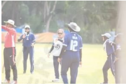
Gambar 10. Tahap Pelatihan 2