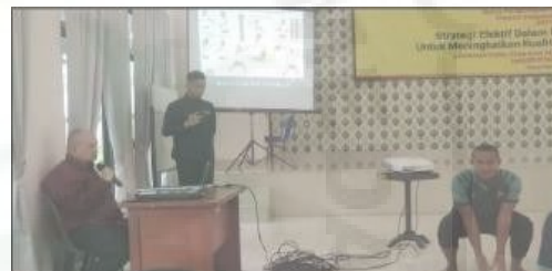
Gambar 7. Narasumber