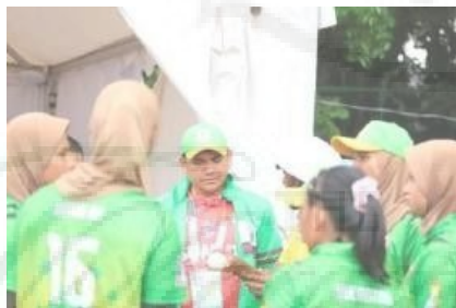
Gambar 11. Tahapan Pendampingan 1

Pendampingan individu dan kelompok dukungan memberikan dampak positif terhadap motivasi atlet. Sesi pendampingan individu dihadiri oleh 80% atlet, dan umpan balik menunjukkan bahwa 70% atlet merasa lebih percaya diri dalam menjalani program rehabilitasi. Kelompok dukungan juga berhasil menciptakan lingkungan yang saling mendukung, di mana atlet dapat berbagi pengalaman dan motivasi.