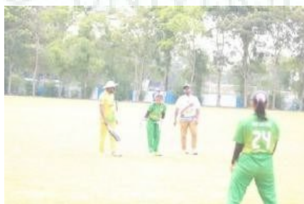
Gambar 12. Tahapan Pendampingan 2