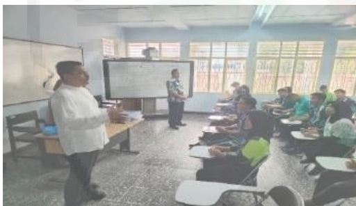
Gambar 4. Pengembangan Materi Pelatihan