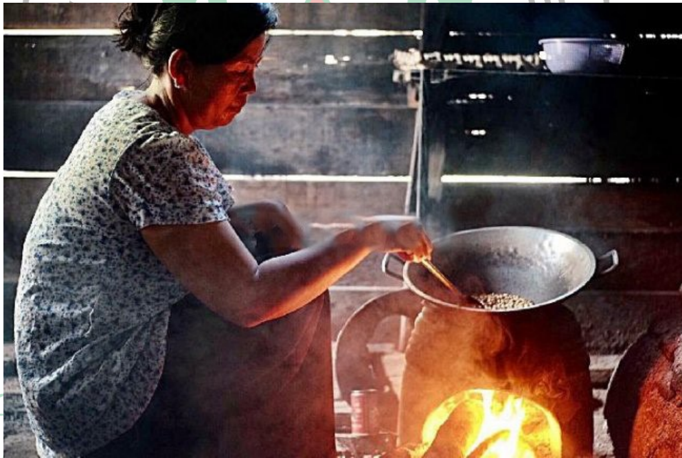
Gambar 1. Proses penyangraian secara manual.

Sehingga saat proses penyangraian kopi dilakukan, dibutuhkan waktu dan tenaga yang cukup banyak karena penggorengan masih menggunakan alat manual. Keadaan tersebut membuat penyangrai kurang efisien dimana suhu disekitar penyangraian menjadi lebih panas (suhu tidak terkontrol) serta pengaduk yang tidak rata, hal ini menyebabkan pekerja mudah lelah. Apabila penyangraian dilakukan dalam skala besar, akan mempengaruhi kualitas dan produktivitas kopi tersebut.