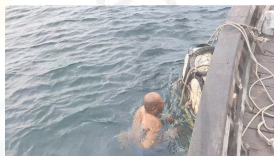
Gambar 8. Proses Pemasangan Pelampung