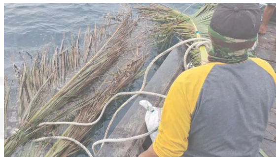
Gambar 7. Peletakan Daun Rumpon