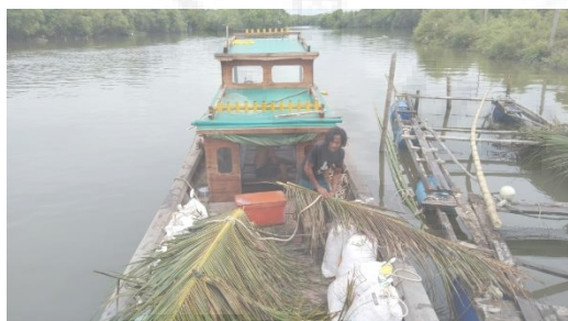
Gambar 5. Proses Pembuatan Rumpon

Bahan yang digunakan dalam pembuatan rumpon adalah daun kelapa, digunakan sebagai rumah atau tempat ikan-ikan berkumpul. Bambu dan ban sebagai pelampung berguna untuk penopang rumpon dan juga sebagai penanda letak rumpon di laut. Goni, pasir, kerikil dan semen untuk menjadi pemberat rumpon kedasar laut. Tali tambang untuk mengikat semua alat yang digunakan rumpon.