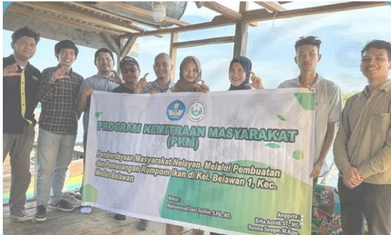
Gambar 8. Sosialisasi Iptek Pemasaran Produk

Pengabdian dilanjutkan dengan melakukan sosialisasi iptek kepada para nelayan. Sosialisasi ini bertujuan untuk memberikan tahapan bagaimana para nelayan dapat memasarkan hasil tangkapan ikan nelayan ke media sosial seperti instagram , facebook dan media sosial lainnya.