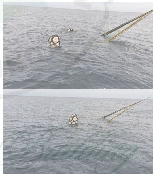
Gambar 9. Rumpon selesai dipasang

Selesai melakukan peletakan rumpon ke laut, membutuhkan waktu 3 sampai 6 bulan untuk ikan, cumi berkumpul dan menjadikan rumpon sebagai rumah baru untuk ikan dan cumi. Hal ini akan mempermudah nelayan untuk mendapatkan ikan. Gambaran rumpon yang berada dibawah laut dapat dilihat pada gambar berikut ini (Toga ikan, 2019):