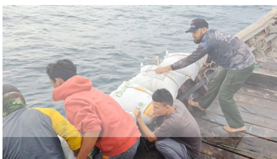
Gambar 6. Peletakan Pemberat Rumpon

Kegiatan pengabdian dilanjutkan dengan pemasangan rumpon oleh tim pengabdian bersama kelompok nelayan bahagia ke titik lokasi yang sudah ditentukan. Nelayan tampak antusias melakukan pengabdian ini guna mendapatkan hasil tangkapan hasil ikan yang lebih baik.