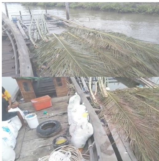
Gambar 2. Bahan Untuk Pembuatan Rumpon

Bahan yang digunakan dalam pembuatan rumpon adalah daun kelapa, digunakan sebagai rumah atau tempat ikan-ikan berkumpul. Bambu dan ban sebagai pelampung berguna untuk penopang rumpon dan juga sebagai penanda letak rumpon di laut. Goni, pasir, kerikil dan semen untuk menjadi pemberat rumpon kedasar laut. Tali tambang untuk mengikat semua alat yang digunakan rumpon.