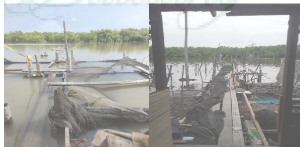
Gambar 1. Survey Ke Lokasi Nelayan

Pengabdian dimulai dengan cara melakukan survey yang dilakukan di kecamatan medan belawan, setelah melakukan survey dan ditentukanlah kelompok nelayan bahagia yang akan menjadi sasaran pengabdian, pengabdian dilanjutkan dengan sosialisasi dan pembuatan rumpon bersama kelompok nelayan bahagia.