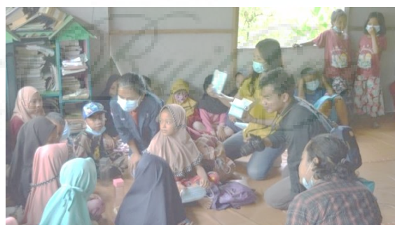
Gambar 1. Aktivitas PBA dalam Bidang Literasi

pendidikan yang merata. PBA berdiri pada tahun 2015, yang memegang misi awal yakni berfokus pada memberantas buta huruf, menulis, dan berhitung.