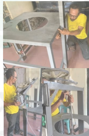
Gambar 4. Perakitan alat pengering bandrek

Pada kegiatan ini tim PKM melakukan sosialisasi dasar mengenai nilai gizi yang terkandung dalam bandrek bubuk melalui metode ceramah. Selanjutnya tim PKM melakukan pelatihan dan pendampingan dalam pembuatan bandrek bubuk.