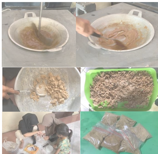
Gambar 6. Proses pembuatan bandrek bubuk