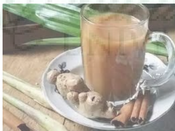
Gambar 1. Bandrek (Mandasari, 2018)

Bandrek adalah minuman tradisional Sunda yang terbuat dari jahe dan biasanya disajikan pada malam yang dingin atau saat musim hujan. Minuman ini terbuat dari jahe, rempah-rempah, dan rempah-rempah lainnya. Bandrek dianggap sebagai minuman premium di era kolonial ketika rempah-rempah sangat dihargai. Nilai rempah-rempah menurun karena perdagangan beralih ke kopi dan teh, begitu pula popularitas bandrek. Rempah-rempah adalah komoditas yang sangat dicari dan dapat ditukar dengan barang berharga seperti emas dan perhiasan.