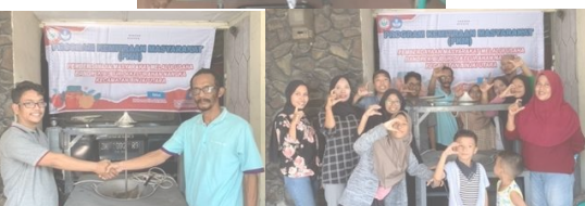
Gambar 5. Penyerahan alat pengering bandrek