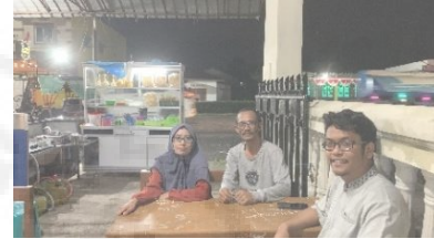
Gambar 3. Tim PKM berkoordinasi dengan mitra

Pada tahap persiapan ini, tim PKM berkoordinasi dengan mitra dalam menyusun jadwal kegiatan untuk memecahkan permasalahan yang dihadapi mitra.