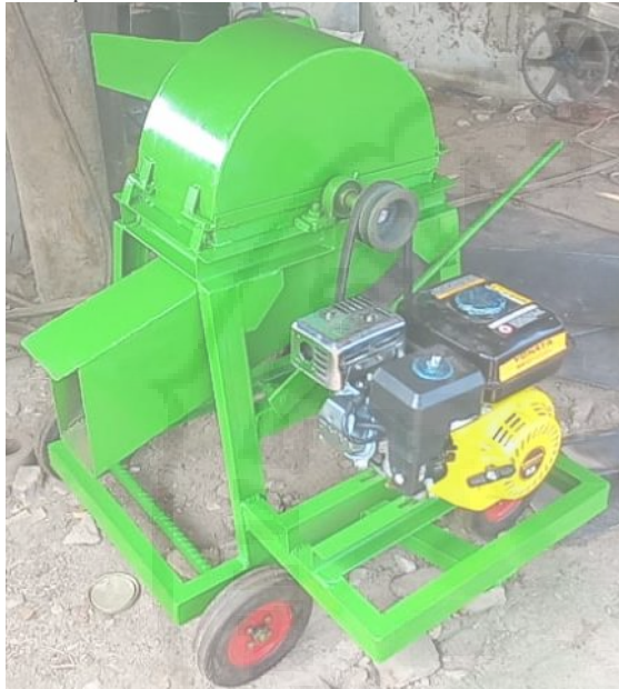
Gambar 4. Mesin Pencacah Multifungsi Tahap Pelaksanaan

analisis kebutuhan lainnya adalah mendesain dan manufaktur mesin pencacah multifungsi yang dapat mencacah dedaunan dengan ukuran rata-rata 3-5 cm. Hasil fabrikasi mesin pencacah multifungsi dapat dilihat pada Gambar 4.