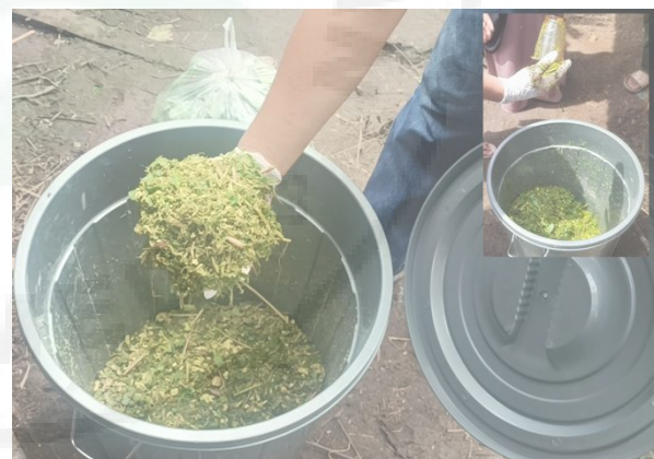
Gambar 7. Bakal Pakan yang Difermentasikan Tahap Evaluasi

Tahap evaluasi telah dilakukan dengan hasil efektif dimana terdapat peningkatan pengetahuan dan keterampilan mitra dalam membuat pakan ternak kambing dengan teknologi silase. Sebanyak 10 orang anggota mitra menjadi responden kegiatan pelatihan. Instrumen evaluasi yang digunakan adalah test dengan dua skema yaitu pre-test dan post-test . Berdasarkan hasil pre-test dan post-test terdapat peningkatan pengetahuan dan keterampilan mitra yang relatif besar dengan range nilai rata-rata sebesar 42. Hasil perbandingan pre-test dan post-test dapat dilihat pada Tabel 1.