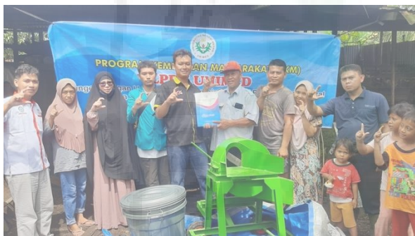
Gambar 8. Pelaksanaan Kegiatan Pelatihan.

Pelatihan ini berjalan dengan baik dengan tercapainya tujuan-tujuan kegiatan. Peningkatan pengetahuan dan keterampilan mitra dalam membuat pakan mandiri menjadi indikator utama pada peningkatan kualitas dan produktivitas usaha mitra. Pembuatan pakan juga menjadi lebih efisien dengan bantuan mesin pencacah multifungsi. Berdasarkan poin-poin tersebut, mitra dapat melakukan ekspansi usaha dan memberikan pembinaan pada usaha terkait. Kegiatan pelatihan dan serah terima mesin pencacah multifungsi dapat dilihat pada Gambar 8.