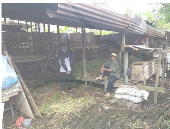
Gambar 3. Kondisi Tempat Stok Pakan

Berdasarkan potensi wilayah sekitar mitra, solusi alternatif yang dapat digunakan adalah dengan memanfaatkan limbah daun dan pohon singkong dengan teknologi silase berbantuan mesin pencacah multifungsi. Pakan silase memiliki keunggulan untuk mengatasi kelangkaan pakan dengan keunggulan masa simpan yang lebih lama, nutreien lebih baik, dan dapat dijadikan pakan cadangan (Kari dkk, 2021; Prayitno, 2020). Daun ubi kayu atau singkong dapat digunakan pakan utama untuk pakan ternak dengan teknologi silase (Marhaeniyanto, 2007; Basri dkk, 2015). Banyaknya limbah daun singkong di daerah mitra menjadi pemilihan utama untuk mengatasi