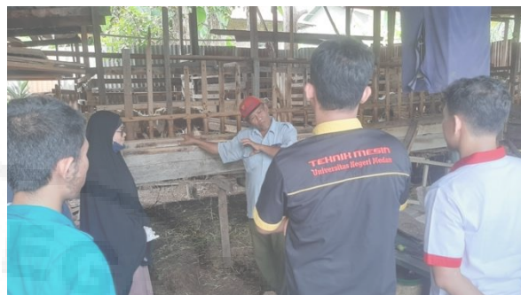
Gambar 9. Diskusi Tindak Lanjut dengan Mitra

Melalui pelatihan ini, usaha mitra dapat berjalan lebih baik dengan bantuan diseminasi ilmu pengetahuan dan teknologi terkait pengolahan pakan ternak kambing. Upaya keberlanjutan yang diterapkan adalah dengan selalu berkoordinasi dan konsultasi dengan mitra sasaran. Upaya lainnya adalah dengan memantau mitra secara berkala dan melakukan observasi terkait perkembangan usaha mitra.