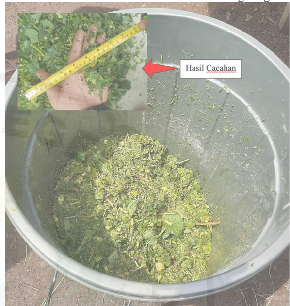
Gambar 6. Hasil Cacahan Daun Singkong