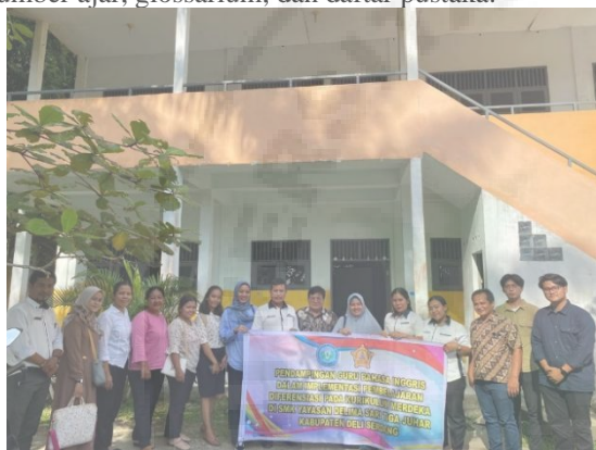
Gambar 3. Workshop Pembuatan Modul Bahan Ajar Diferensiasi Berbasis Kurikulum Merdeka.

ajar berbasis diferensiasi. Pada sesi ini, peserta diperkenalkan dengan modul ajar bahasa Inggris berbasis diferensiasi. Modul ajar ini terdiri dari Informasi umum yang berisi; target peserta didik, kompetensi awal, profil pelajar, sarana dan prasarana. Dilanjutkan dengan konten ini yang berisi; Tujuan pembelajaran, pemahaman bermakna, pertanyaan pemantik, kegiatan pembelajaran, asesmen, refleksi guru serta peserta didik. Pada konten akhir modul ditampilkan Lembar Kerja (LKPD), bahan bacaan, sumber ajar, glossarium, dan daftar pustaka.