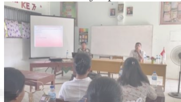
Gambar 2. FGD dan Pendampingan Pembelajaran Diferensiasi.