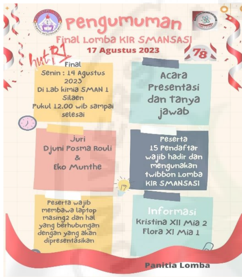
Gambar 5. Pengumuman Final KIR.