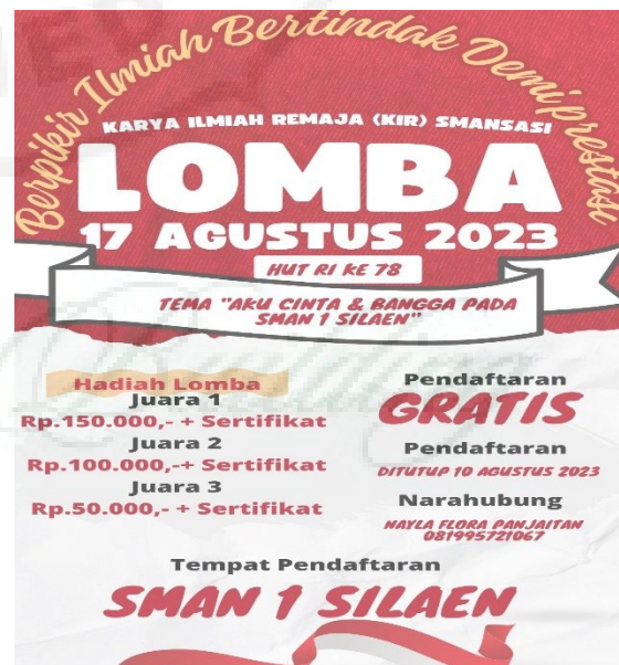
Gambar 3. Flyer Lomba KIR.

Link twibonize bagi peserta lomba KIR dalam memperingati HUT ke-78 Kemerdekaan Republik Indonesia https://twb.nz/kirmsansasihutri2023