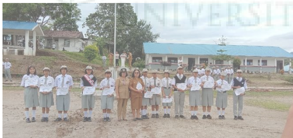
Gambar 7. Pemberian Hadiah Pemenang Lomba KIR.

Jumlah kelas atau rombongan belajar di SMAN 1 Silaen kelas X : 6 kelas MIA/sosial, Kelas XI : 6 kelas MIA/sosial dan kelas XII : 7 kelas MIA/sosial