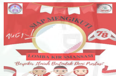
Gambar 2. Twibonize Peserta.

Kegiatan pertama KIR SMAN 1 Silaen mengadakan lomba KIR antar kelas yang berjumlah 19 kelas dengan memberikan pengumuman pada facebook SMAN 1 Silaen dan mengumumkannya di ke kelas oleh paniti KIR yang anggotanya siswa SMAN 1 Silaen. Setiap peserta wajib menggunakan twibonize sebagai promosi adanya ekstrakurikuler KIR dan mengajak peserta untuk mengikuti lomba KIR