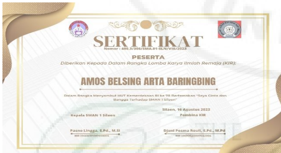
Gambar 6. Sertifikat Pemenang dan Peserta.