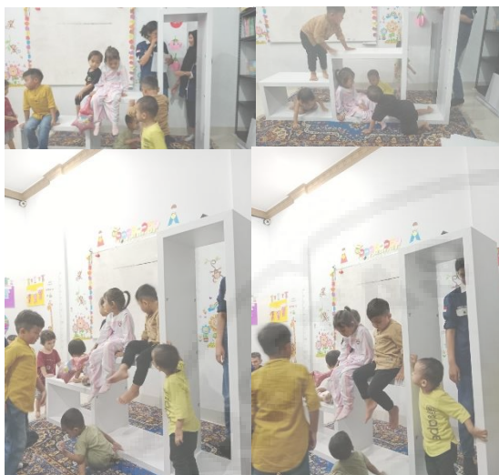
Gambar 7. Tahap Evaluasi Awal Oleh Pengguna Pada Mitra-2