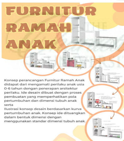
Gambar 2. Desain Furnitur Ramah Anak