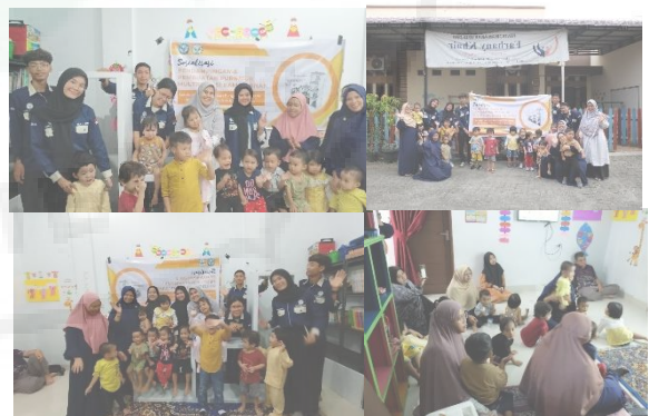
Gambar 6. Kegiatan Sosialisasi dan FGD Penggunaan Produk Inovasi Oleh Tim Dan Mahasiswa Prodi Arsitektur UNIMED

Setelah menyelesaikan pekerjaan pembuatan furniture tersebut, mitra-2 menyerahkan produk inovasi kepada mitra-1. Pelaksanaan selanjutnya yaitu sosialisasi dan FGD tata cara penggunaan produk inovasi. Gambar 6 menjelaskan tahap pelaksanaan yang dilakukan tim PKM beserta mahasiswa saat melakukan sosialisasi dan FGD.