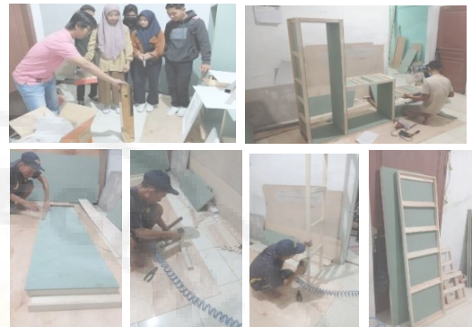
Gambar 5. Tahap Pelaksanaan Pembuatan Rak Multifungsi Oleh Mitra-2

Tahap pelaksanaan program kemitraan ini dimulai dari tahap persiapan yang sudah dilakukan ke mitra-1 selanjutnya pelaksanaan dilakukan oleh mitra-2 untuk pembuatan rak multifungsi. Gambar 5 menjelaskan kegiatan pelaksanaan pembuatan rak multifungsi yang melibatkan mitra-2 dan mahasiswa prodi arsitektur sebagai bahan pembelajaran diluar dalam pengenalan material furniture.