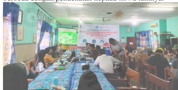
Gambar 4. Suasana interaktif dan tanya-jawab antara guru-guru dengan narasumber terkait pengembangan asesmen autentik.

kedua parameter siswa tersebut, maka Langkah selanjutnya adalah mempersiapkan perangkat pembelajaran, model, media, dan bentuk asesmen yang dirangkum dalam sebuah modul ajar. Bagi peserta didik yang membutuhkan perhatian khusus untuk mencapai tujuan pembelajaran maka akan dilakukan pendekatan secara khusus juga yang tentu berbeda dengan pendekatan kepada siswa lainnya.