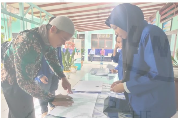
Gambar 1. Proses registrasi peserta pelatihan pengembangan asesmen autentik bagi guru-guru SMP Kabupaten Deli Serdang di SMPN 1 Percut Sei Tuan

Pelatihan pengembangan asesmen autentik dalam pembelajaran di sekolah khususnya untuk guru-guru SMP di lingkungan dinas Pendidikan Kabupaten Deli Serdang mendapat apresiasi dan antusias yang luar biasa dari guru-guru. Terbukti dari 40 peserta guru yang diundang telah hadir semua. Bahkan beberapa guru lainnya langsung berinisiatif sendiri hadir dalam kegiatan tersebut tanpa harus mendapat undangan karena mengetahui adanya kegiatan pengembangan asesmen autentik. Untuk mengetahui jumlah kehadiran peserta maka panitia melakukan pendataan melalui pengisian daftar hadir seperti ditunjukkan pada Gambar 1.