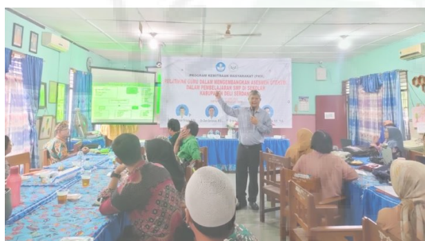
Gambar 3. Paparan dari narasumber pelatihan terkait hal-hal yang perlu diperhatikan dalam penyusunan asesmen autentik dalam pembelajaran di kelas.