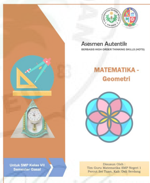
Gambar 5. Tampilan sampul produk dokumen asesmen autentik mata pelajaran Matematika SMP Negeri 1 Percut Sei Tuan

Hal seperti itulah (pendekatan pembelajaran berdiferensiasi ) yang ditunjukkan narasumber dalam kegiatan pelatihan ini seperti ditunjukkan pada Gambar 4. Melalui pendekatan pembelajaran berdiferensiasi ini maka guru-guru peserta pelatihan dapat menghasilkan produk pelatihan seperti ditunjukkan pada Gambar 5. Adapun produk yang dihasilkan dari kegiatan pelatihan ini diantaranya adalah dokumen asesmen autentik per mata pelajaran, kisi-kisi soal (asesmen) untuk peserta didik, instrumen soal, rubrik penilaian untuk setiap butir soal dan lembar kerja peserta didik khusus untuk beberapa