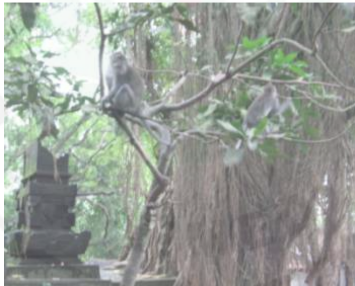
Gambar 6. Kera Bergelantungan di Objek Wisata Wanara Wana sebagai Wisata Wana

Taman burung ini dibuat untuk kepentingan pariwisata dan pelestarian burung bertaraf internasional. Keberadaan taman burung yang mengoleksi berbagai jenis burung itu menjadi salah satu inspirasi bagi masyarakat Gianyar dalam membuat dan menciptakan karya seni kerajinan maupun seni lukis yang menampilkan objek burung dengan berbagai macam gaya. Demikian juga dengan wanara wana (hutan kera) yang terletak di desa adat Padang Tegal, Kecamatan Ubud, Kabupaten Gianyar. Kera-kera ( Macacus cynomolgus ) yang lucu, lincah, dan tidak jarang mau diajak bercanda dengan komunitas wisatawan merupakan atraksi dari gerak kera yang dapat memberikan hiburan. Komunitas wisatawan yang menikmati objek wisata wanara wana juga bisa belanja cenderamata yang tersedia di artshop .