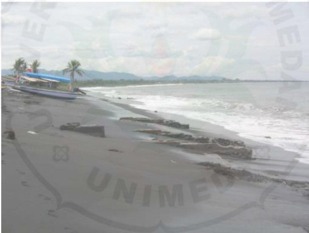
Gambar 4. Pantai Lebih sebagai Objek Wisata Bahari

Namun demikian keberadaan pantai yang tersebar di Gianyar juga turut andil dalam perkembangan kepariwisataan di Kabupaten Gianyar. Seperti yang terdapat di Monografi Kabupaten Gianyar , bahwa pantai yang ada di Gianyar juga ramai dikunjungi oleh wisatawan, meskipun masih didominasi oleh wisatawan domestik, terutama pada hari-hari raya tertentu, kegiatan keagamaan, dan hari-hari libur lainnya.