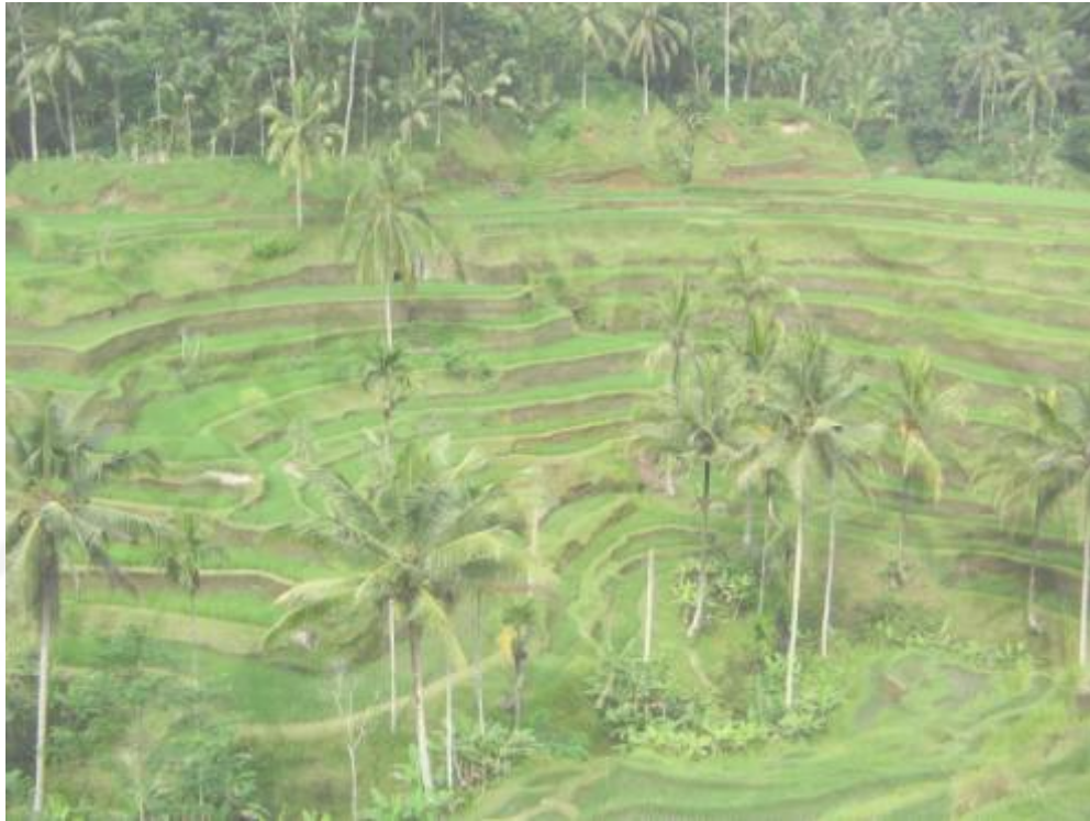
Gambar 5. Sawah Berteras sebagai Objek Wisata Alam