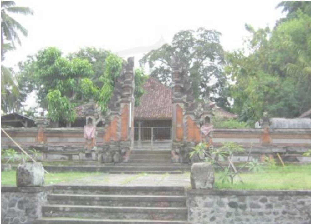
Gambar 3. Objek Wisata Bukit Jati sebagai Wisata Remaja