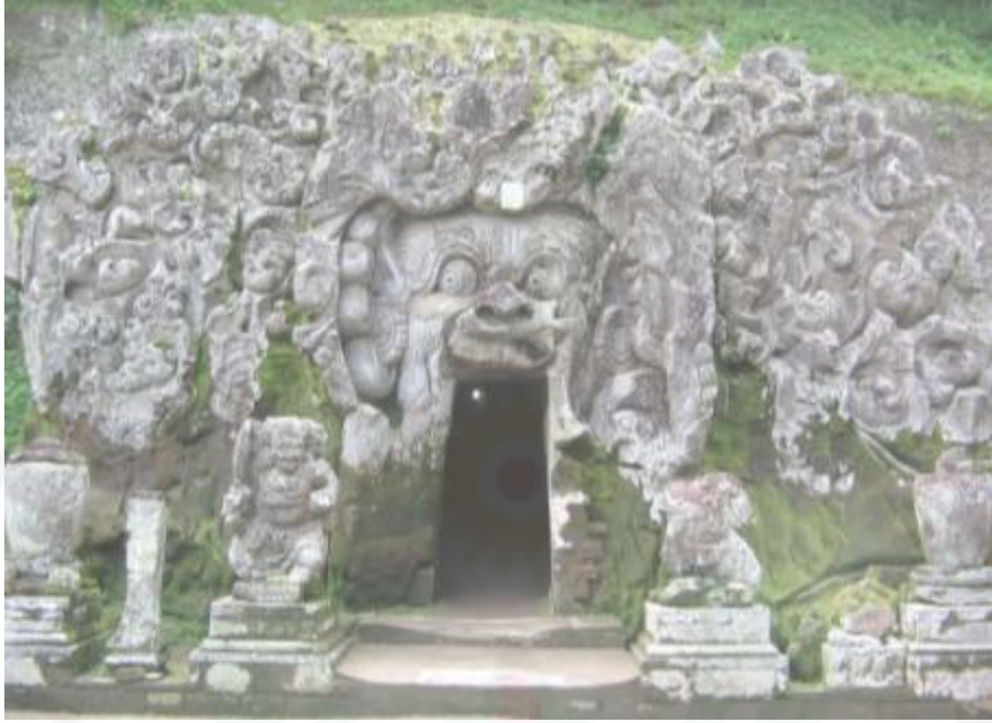
Gambar 1. Objek Wisata Goa Gajah sebagai Wisata Purbakala

UNIMED UNIVERSITY THE Character Building UNIVERSITY