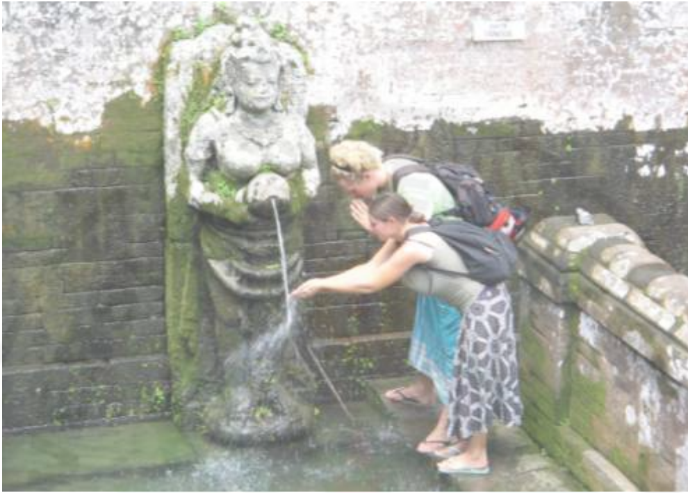
Gambar 2. Wisatawan Mancanegara di Petirtaan Sapta Gangga Objek Wisata Goa Gajah sebagai Wisata Purbakala