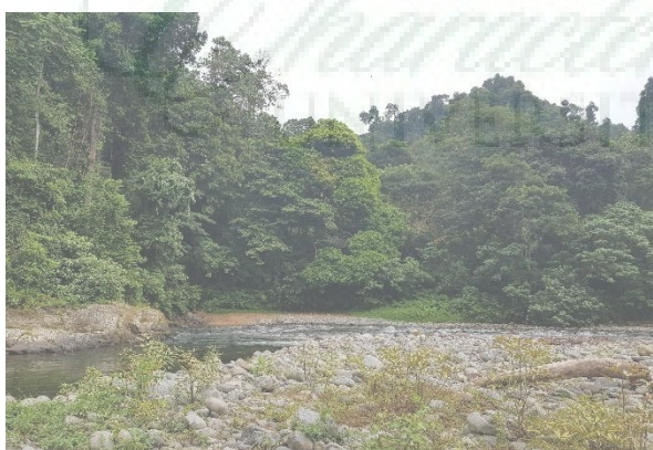
Gambar 24. Lokasi Potensi Terjadinya Tanah Tumbuh Dan Gerusan Pada Aliran Sungai.

Terlihat pada Gambar 24 terjadinya tanah tumbuh dan gerusan alibat aliran sungai yang akan mengubah morfologi sungai tersebut. Aliran air yang menggerus tanah lama kelamaan akan menyebabkan berubahnya aliran sungai tersebut, serta menimbulkan bentuk aliran sungai yang baru.