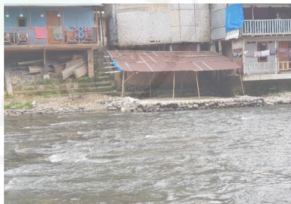
Gambar 26. Lokasi Potensi Kerusakan Bangunan Akibat Gerusan.

Gambar 26 menunjukkan bronjong yang dibangun pada konstruksi pinggir sungai, yang digunakan untuk mengurangi gerusan air terhadap bangunan rawan longsor pinggir sungai.