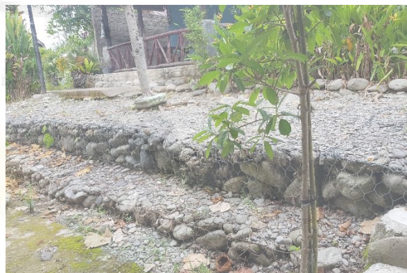
Gambar 25. Bronjong Di Daerah Lokasi Pengamatan.

Pada lokasi pengabdian ditemui beberapa lokasi yang menggunakan konstruksi bronjong (Gambar 25). Akan tetapi, pada beberapa tempat dijumpai konstruksi bangunan yang tidak menggunakan bronjong pada daerah pinggir sungai.