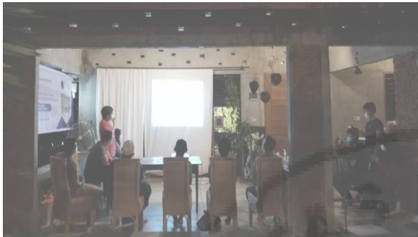
Gambar 19. Penjelasan Mengenai Bangunan Pada Daerah Rawan Longsor Terhadap Kelompok Tukang Bangunan Di Desa Perkebunan Bukit Lawang.