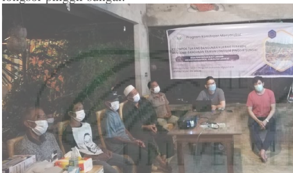
Gambar 20. Diskusi Dan Pemberian Umpan Balik Kepada Kelompok Mitra.

Diskusi dan tanya jawab dilakukan untuk mengetahui sejauh mana pemahaman mitra terkait dengan informasi tentang standar bangunan yang telah dipaparkan oleh tim pengabdian, serta untuk mendapatkan umpan balik dari kelompok mitra ( Gambar 20 ). Hasil dari diskusi dan tanya jawab diperoleh informasi mengenai hal yang kerap menjadi permasalahan pada bangunan rawan longsor, dalam hal ini yang sering terjadi di sekitar lokasi tempat bekerja kelompok mitra, yakni di Desa Perkebunan Bukit Lawang, Kecamatan Bahorok, Kabupaten Langkat. Pada sesi terakhir ini diberikan buku saku sebagai pedoman bagi kelompok tukang bangunan kurang terampil mengenai bangunan rawan longsor pinggir sungai di Desa Perkebunan Bukit Lawang, Kecamatan Bahorok, Kabupaten Langkat, yang memuat mengenai konstruksi, standar, maupun prosedur yang berkaitan dengan bangunan rawan longsor pinggir sungai.