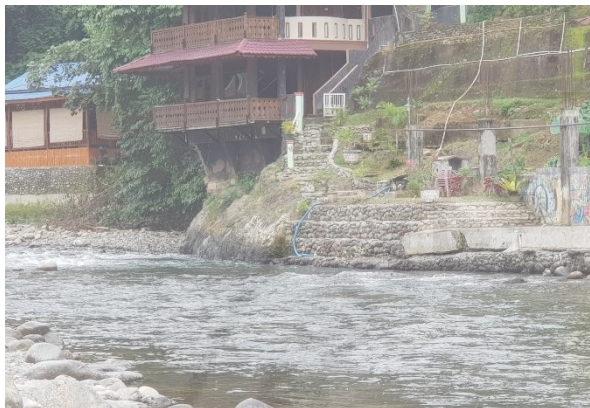
Gambar 22. Kondisi DAS Yang Akan Menggerus Bagian Bangunan Di Sekitar Daerah Pengabdian.

daerah aliran sungai. Kerusakan tersebut akan berakibat pada konstruksi bangunan yang kurang aman.