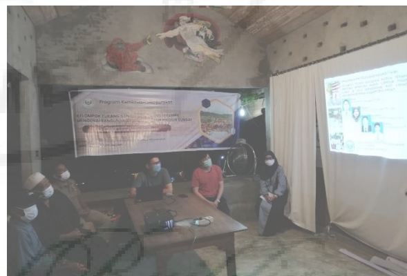
Gambar 18. Pelaksanaan Kegiatan Pemberdayaan Terhadap Kelompok Tukang Bangunan Di Desa Perkebunan Bukit Lawang.

Kegiatan yang dilakukan yaitu mengundang kelompok tukang bangunan yang dijadikan mitra melalui dialog dan perkenalan ke kelompok mitra sasaran yaitu kelompok tukang bangunan kurang terampil mengenai bangunan rawan longsor pinggir sungai di Desa Perkebunan Bukit Lawang, Kecamatan Bahorok, Kabupaten Langkat ( Gambar 18 ).