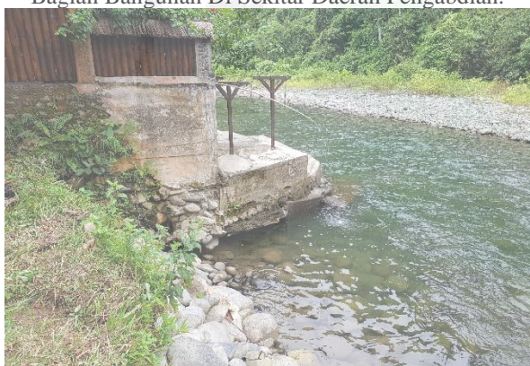
Gambar 23. Lokasi Potensi Kerusakan Bangunan Akibat Gerusan.

Terlihat pada Gambar 24 terjadinya tanah tumbuh dan gerusan alibat aliran sungai yang akan mengubah morfologi sungai tersebut. Aliran air yang menggerus tanah lama kelamaan akan menyebabkan berubahnya aliran sungai tersebut, serta menimbulkan bentuk aliran sungai yang baru.