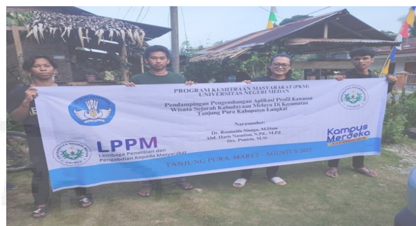
Gambar 3. Kegiatan Pelatihan Penggunaan Dan Serah Terima Aplikasi System Informasi Pariwisata Kepada Mitra.