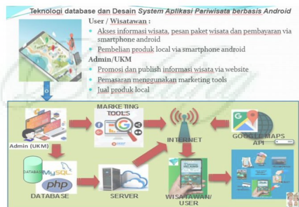
Gambar 1. Desain System Informasi Pariwisata

Gambaran tampilan aplikasi obyek wisata berbasis android untuk wisatawan seperti tampak gambar berikut, user dapat mengakses informasi melalui website gotriprajaampat.com dan dapat mengakses dengan smartphone android. Aplikasi dapat di install melalui google play store terlebih dahulu. Berikut gambaran sistemnya.