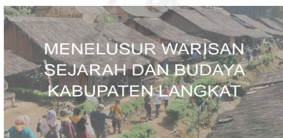
Gambar 2. Tampilan Profil Aplikasi Kebudayaan Melayu Tanjungpura dari Android