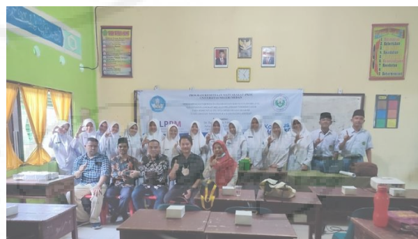
Gambar 3. Penyerahan desain Produk cenderamata Pada Mitra

Menutup kegiatan, Tim PKM menyerahkan produk cenderamata berupa desain produk cenderamata wisata sejarah kec Tanjung Pura.