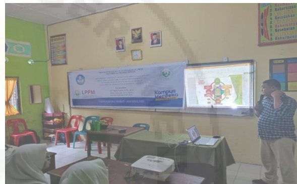
Gambar 2. Penyajian materi oleh Arfan Diansyah.

Dalam kegiatan ini Arfan juga memberikan penguatan kompetensi mitra dalam mengembangkan produk booklet Wisata Sejarah, Peta Wisata Sejarah dan Rintisan Aplikasi Wisata Sejarah Tanjungpura.