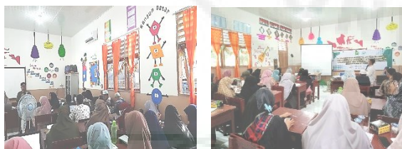
Gambar 3. Proses pelaksanaan pelatihan c. Tahap Evaluasi

Pelatihan berjalan lancar, dan para guru dengan senang hati berpartisipasi. Sejalan dengan itu, kemampuan guru dalam menyusun modul pembelajaran merdeka berbasis kurikulum semakin meningkat.