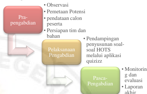
Gambar 2. Tahap Pelaksanaan PKM

Pengabdian. Adapun lebih jelasnya dapat dilihat melalui grafik berikut.