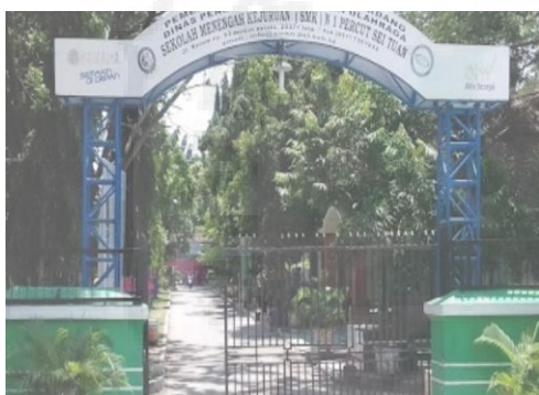
Gambar 1. Suasana halaman sekolah SMA Negeri 1 Percut Sei Tuan

Berdasarkan hasil wawancara dengan 3 orang guru di Sekolah SMAN 1 Percut Sei Tuan bahwa sangat jarang sekali menerapkan evaluasi (asesment) berbasis HOTS disebabkan kurang terampilnya dalam pembuatan soal HOTS dan tidak adanya sosialisasi atau pelatihan kepada guru bagaimana cara membuat soal berbasis HOTS, selain itu tidak adanya panduan dalam bentuk buku, modul atau sejenisnya yang menjadi pegangan guru-guru dalam mempelajari cara penyusunan soal HOTS.