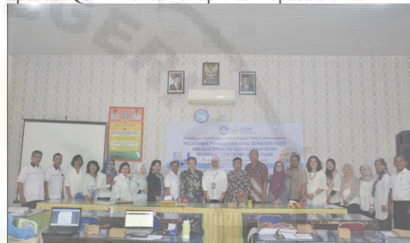
Gambar 12. Tim bersama Mitra Melakukan Foto Bersama

Berdasarkan hasil pelatihan dan pendampingan, semua guru mampu menyusun sola HOTS berdasarkan hasil evaluasi dari Ahli, kemudian rata-rata guru sudah mampu memuat soal HOTS melalui aplikasi Quizizz untuk di aplikasi kepada siswa.