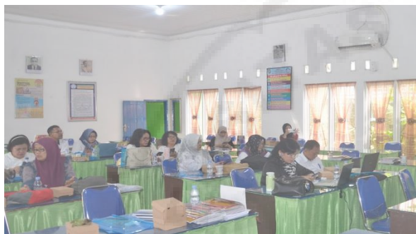
Gambar 10. Guru-guru Berdiskusi Menyusun Soal HOTS

Setelah pelatihan, narasumber memberi pendampingan kepada guru untuk menyusun sendiri soal berbasis HOTS pada bidang studi masing-masing.