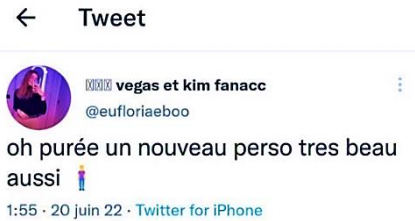
Image.1.3. Exemple troncation des mots

Voici un exemple de tweet avec une troncation que l'on peut voir.