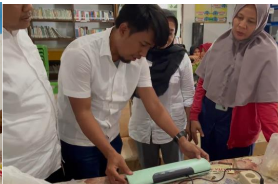
Gambar 5. Kegiatan Penggunaan Alat Mesin Vacum Sealer