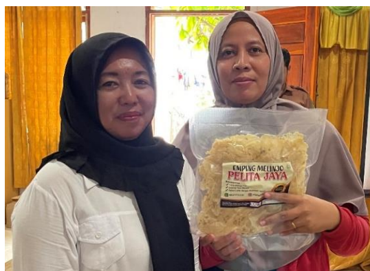
Gambar 7. Kemasan Vacum Emping Pelita Jaya