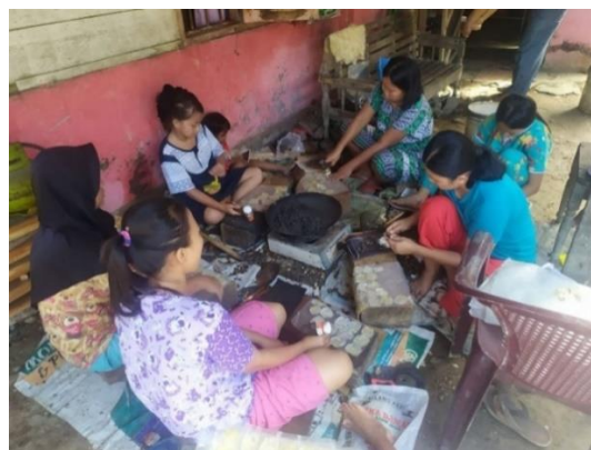
Gambar 3. Hasil Produksi Emping di Rumah Mitra 2

Sasaran kegiatan pengabdian ini dilakukan kepada 2 kelompok mitra petani emping di Desa Baru Pasar VIII, Kecamatan Hinai, Kabupaten Langkat. Metode pelaksanaan kegiatan meliputi tahap persiapan dan pelaksanaan kegiatan. Pada tahap persiapan melakukan persiapan dengan a). Melakukan observasi awal ke tempat Mitra, b). Melakukan sosialisasi dengan Mitra tentang rencana kegiatan yang akan dilakukan, c). Diskusi dengan Mitra menentukan jadwal dan tempat kegiatan, dan d). Melaksanakan kegiatan sesuai dengan rencana kegiatan, jadwal kegiatan, dan tempat kegiatan.