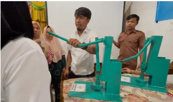
Gambar 4. Kegiatan Penggunaan Alat Press Emping Manual

Pada kegiatan ini tim penyuluh memberikan penyuluhan dan praktik langsung menggunakan mesin vacum sealer untuk pengemasan emping kering yang sudah siap jual, lihat pada Gambar 5. Pada kesempatan ini tim pengabdian memberikan alat mesin vacum sealer serta plastik kemasan untuk vacum sealer sebanyak 2 unit untuk dibagi kepada 2 mitra. Hal ini sejalan dengan pendapat Mufrenia (2016) bahwa desain kemasan akan mempengaruhi minat beli konsumen.