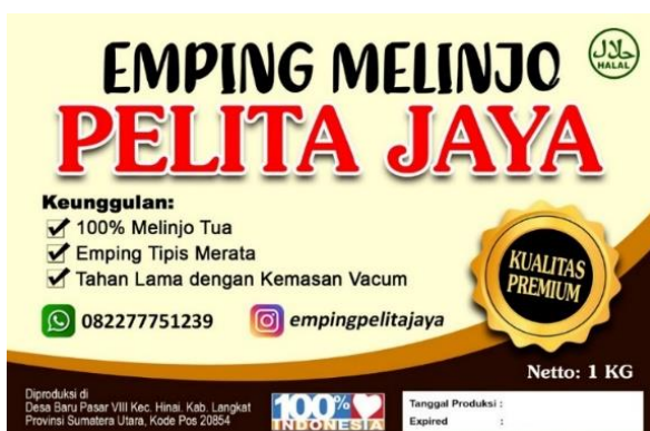
Gambar 6. Desain Merek Dagang Emping Pelita Jaya

Label makanan bukan hanya berisi merek untuk branding dan ketentuannya telah secara jelas diterangkan dalam PerBPOM No.31 Tahun 2018. Menurut peraturan tersebut informasi yang harus ada dalam sebuah label produk makanan harus memuat beberapa keterangan paling sedikit mengenai: a). Nama produk., b). Daftar bahan yang digunakan., c). Berat bersih dan isi bersih (netto)., d). Nama dan alamat pihak yang memproduksi., e). Informasi Halal produk., f). Tanggal/kode produksi., g). Keterangan kedaluarsa., h). Mencantumkan nomor izin edar (BPOM RI MD). Untuk BPOM belum bisa dicantumkan mengingat merek dagang “Pelita Jaya” belum didaftar izin edarnya. Adapun hasil diskusi desain merek dagang emping ini sebagai berikut: