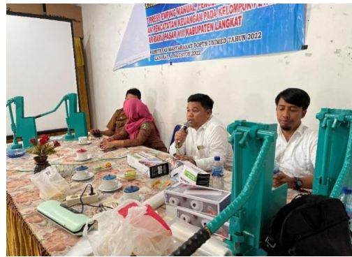
Gambar 8. Pelatihan Pencatatan Keuangan

Berdasarkan sumber berita analisadaily.com yang diakses pada 28 Januari 2022 bahwa emping kering mampu bertahan di tempat kering sampai 2 tahun ( https://analisadaily.com/berita/arsip/2014/4/13/21916/emping-melinjo-usaha-yang-menjanjikan ). Sehingga dalam penyuluhan ini disepakati masa kadaluarsa emping melinjo yang sudah diplastik vacum sealer adalah selama 2 tahun.