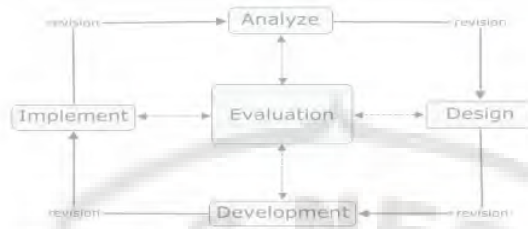
Gambar 1. Skema Model ADDIE

Teknik analisis data dilakukan dengan menggunakan teknik analisis deskriptif, yaitu dengan menganalisis data kuantitatif yang diperoleh dari angket uji ahli dan uji lapangan kemudian ditafsirkan dalam pengertian kualitatif (Arikunto, 2016). Setelah data diperoleh, selanjutnya adalah menganalisis data tersebut. Untuk menganalisis data dari angket, dengan menghitung skor dari tiap-tiap subvariabel dengan rumus: