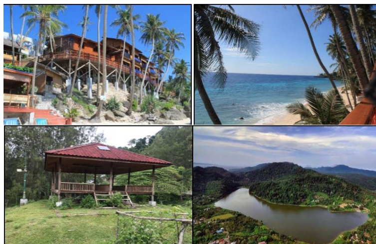
Gambar 2. Destinasi Wisata Pantai Sumur Tiga dan Danau Aneuk Laot

Tinggi dan rendahnya nilai yang di dapatkan pada destinasi wisata dikarenakan pengelolaan destinasi wisata yang berbed-beda. Destinasi wisata di Pulau Weh (Sabang) dikelola oleh berbagai pihak baik swasta, individu, masyarakat gampong (kelurahan), dan pemerintah. Penilaian destinasi wisata yang memiliki nilai paling tinggi dan kategori paling tinggi banyak yang dikelola oleh pihak individu dan swadaya masyarakat gampong (kelurahan), misalnya pantai sumur tiga dan pantai iboih, sedangkan yang memiliki nilai paling rendah dan kategori buruk dibangun oleh pemerintah daerah tetapi tidak terawat dengan baik. Untuk lebih jelasnya beberapa destinasi wisata di Pulau Weh (Sabang) dapat dilihat pada Gambar 2 berikut.