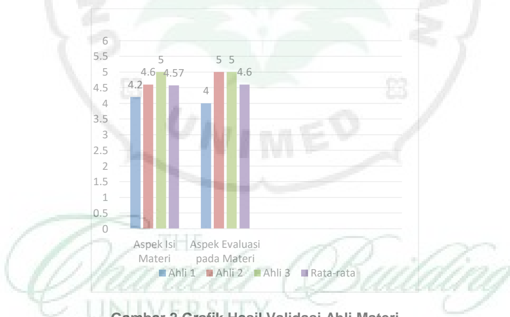
Gambar 2 Grafik Hasil Validasi Ahli Materi

Berdasarkan dari hasil penilaian validasi ahli materi I, ahli validasi materi II dan ahli validasi materi III bahwa hasil Rata-rata keseluruhan dengan nilai 4,58 jika dikategorikan dengan tingkat kelayakan bahwa Materi Media pembelajaran yang dikembangkan dinyatakan Sangat Layak . Jadi kesimpulan yang didapat bahwa produk yang dikembangkan oleh peneliti menurut data jumlah keseluruhan rata-rata yang dinilai oleh ahli materi di kategorikan yang memiliki total rata-rata keseluruhan adalah 3,28 dengan kategori baik atau “Sangat Layak” .