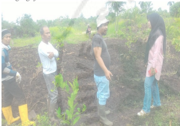
Gambar 3. Proses Pembersihan Lahan KEM

Lahan KEM yang mula-mula masih banyak semak belukar secara berangsur-angsur dibersihkan. Pembersihan lahan dilakukan secara gotong royong oleh anggota Kelompok Tani Juara menggunakan peralatan pertanian yang dibeli dari dana PERTAMINA. Peralatan untuk membersihkan lahan yang dibeli dan digunakan antara lain mesin potong kayu, mesin potong rumput, pisau, cangkul, linggis dan gergaji.