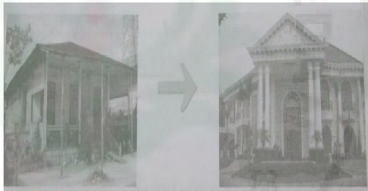
Gambar 1. Konsep Rumah Jaman Dulu Ke Rumah Modern

kegiatan masyarakat pulau Kalimantan dalam berdagang di pasar yang memanfaatkan sungai sebagai pasar