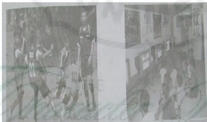
Gambar 2. Perubahan cara Menonton Sepak Bola

terapung. Dalam buku tersebut juga dimuat perubahan nilai-nilai sosial dan budaya masyarakat terkait konsep rumah masyarakat jaman dulu