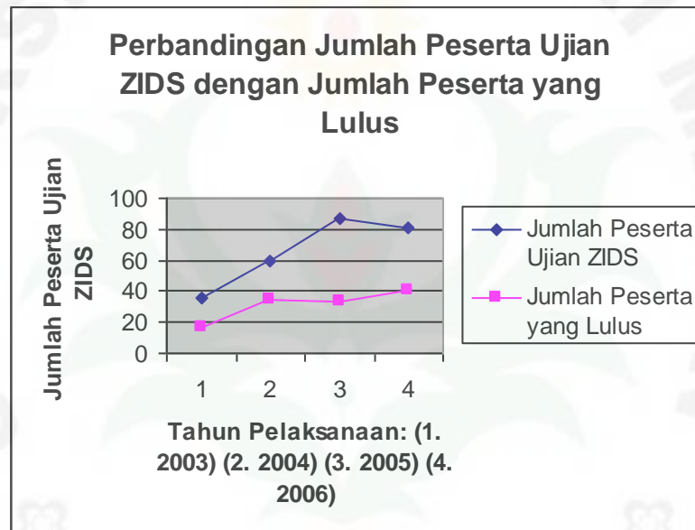
Gambar 1: Grafik Perbandingan Jumlah Peserta Ujian ZIDS dengan Jumlah Peserta yang Lulus.

Data di atas menunjukkan bahwa tingkat keberhasilan pembelajaran bahasa Jerman pada Prodi ini masih rendah, terutama dalam ujian kemampuan berbahasa Jerman tingkat dasar ( ZIDS ). Mahasiswa masih memiliki kelemahan dalam menjawab dan mengerjakan soal ujian ZIDS . Dari skor yang diperoleh mahasiswa pada keterampilan menulis, dalam hal ini menulis surat pribadi ( persönlicher Brief ), masih rendah, bahkan banyak yang dibawah skor rata-rata atau batas minimal kelulusan, yaitu skor 27. Dari 263 peserta, 132 peserta memperoleh skor di bawah skor 27 atau skor 0-25,5. Berarti dalam menulis surat pribadi ( persönlicher Brief ) ketika ujian ZIDS berlangsung, mahasiswa banyak melakukan kesalahan-kesalahan menurut penilaian dan kriteria surat dalam bahasa Jerman. Kesalahan-kesalahan mahasiswa ini tentunya berkaitan dengan proses pembelajaran yang selama ini terjadi pada Prodi Bahasa Jerman, khususnya pengajaran keterampilan menulis.