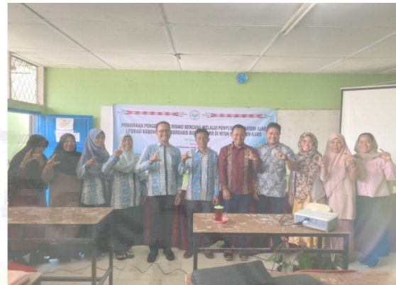
Gambar 2. Suasana pelatihan di MTSN Karo