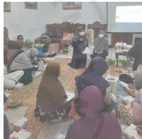
Gambar 6. Evaluasi Pelatihan dengan Post-test