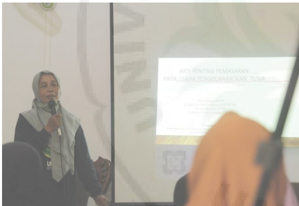
Gambar 4. Pelaksanaan Pelatihan Pemasaran Olahan Ikan Tuna Di Girisubo

Program Kemitraan Masyarakat ini dapat mendukung penciptaan ekonomi produktif masyarakat pesisir Pantai Sadeng lebih optimal. Evaluasi dilakukan dengan memberikan pre-test dan post-test kepada peserta pelatihan pemasaran (Gambar 5 dan 6) sebagai target pemberdayaan. Dari hasil tes sebagai evaluasi dapat dikatakan berhasil karena terdapat peningkatan pengetahuan mengenai pemasaran dari 6,17 menjadi 7,06 atau meningkat sebesar 14.41% (Gambar 7). Hal ini sejalan dengan Didah dkk (2020) dan Hamdani dkk (2022) yang menyatakan bahwa dengan adanya pelatihan akan meningkatkan pengetahuan dan ketrampilan peserta.