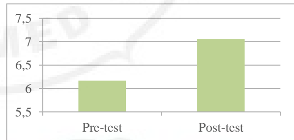
Gambar 7. Hasil Pre-test dan Post-test Pelatihan Pemasaran di Girisubo

Peserta sebenarnya telah memiliki pengetahuan dasar pemasaran, tetapi kesulitan berinovasi dalam implementasinya. Oleh karena itu, untuk mengembangkan pemasaran produk olahan ikan tuna dapat dipasarkan secara kolektif melalui kelompok-kelompok usaha dengan melibatkan karang taruna, PKK, dan Pelabuhan Perikanan Pantai (PPP) Sadeng. Setelah mendapatkan pelatihan pemasaran, semua peserta menyatakan ingin menggunakan pemasaran secara online. Generasi muda dapat menjadi inisiator dan motor masyarakat pesisir Pantai Sadeng untuk terus mengembangkan inovasi pemasaran produk olahan ikan tuna karena lebih terampil dalam menggunakan teknologi informasi. Selanjutnya dapat