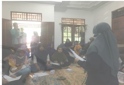
Gambar 5. Pelaksanaan Pre-test

Program Kemitraan Masyarakat ini dapat mendukung penciptaan ekonomi produktif masyarakat pesisir Pantai Sadeng lebih optimal. Evaluasi dilakukan dengan memberikan pre-test dan post-test kepada peserta pelatihan pemasaran (Gambar 5 dan 6) sebagai target pemberdayaan. Dari hasil tes sebagai evaluasi dapat dikatakan berhasil karena terdapat peningkatan pengetahuan mengenai pemasaran dari 6,17 menjadi 7,06 atau meningkat sebesar 14.41% (Gambar 7). Hal ini sejalan dengan Didah dkk (2020) dan Hamdani dkk (2022) yang menyatakan bahwa dengan adanya pelatihan akan meningkatkan pengetahuan dan ketrampilan peserta.