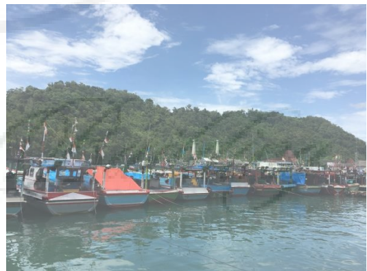
Gambar 1. Pelabuhan Pantai Sadeng

Kecamatan Girisubo, Gunungkidul merupakan salah satu kantong kemiskinan di Provinsi Daerah Istimewa Yogyakarta. Kekeringan dan terbatasnya ketersediaan air permukaan menjadi kendala utama dalam kegiatan pertanian dan peternakan. Hal ini mengakibatkan pembangunan ekonomi di Kecamatan Girisubo, Gunungkidul relatif tertinggal dibandingkan kecamatan lain (Antriyandarti dkk, 2018). Sumber daya alam dan agroklimat yang kurang sesuai untuk kegiatan pertanian menjadi faktor utama kecilnya pendapatan masyarakat pedesaan di Girisubo, sehingga angka kemiskinan menjadi tinggi (Retnowati, dkk, 2014; BPS, 2020). Sementara itu, Kecamatan Girisubo juga memiliki sumber daya alam berupa pantai di pesisir selatan. Untuk meningkatkan perekonomian masyarakat Girisubo, Pemerintah Provinsi Daerah Istimewa Yogyakarta membangun Pelabuhan Perikanan Pantai Sadeng (Gambar 1).