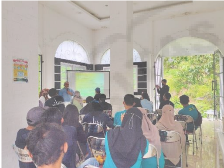
Gambar 3. Sosialisasi Program Pengabdian Masyarakat bersama Pengurus Dilem Wilis

menjelaskan tentang energi surya dan pemanfaatannya dan tahap ketiga sekaligus mengenai pemasangan di titik lokasi yang akan dilaksanakan. Dari ketiga tahap sosialisasi yang telah dilakukan selalu mendapatkan respon positif.