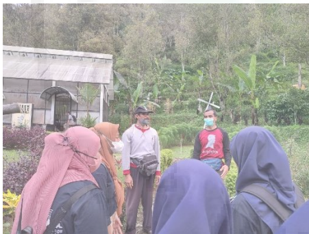
Gambar 4. Pengurus Dilem Wilis dan Survey Lapangan Keadaan Sekitar