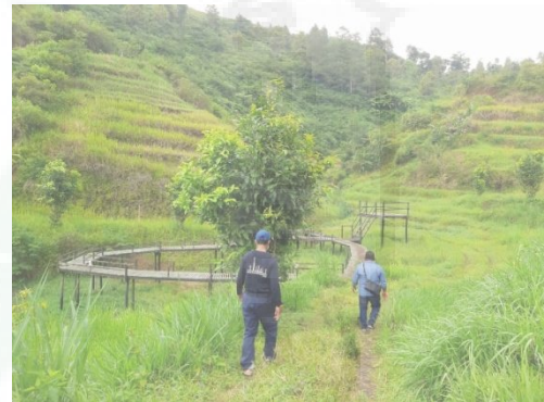
Gambar 1. Penempatan Lokasi Titik Pemasangan Panel Surya

Kegiatan ini dilaksanakan di STP/TTP Dilem Wilis yang terletak di Desa Dompiong, Kecamatan Bendungan, Kabupaten Trenggalek. Sebagaimana dapat dilihat pada Gambar 1. Kegiatan ini diawali dengan penentuan lokasi atau titik pemasangan lampu jalan tenaga surya. Kondisi situasi lingkungan yang lumayan jauh dari jaringan listrik, maka membuat wisata camping ground ini menjadi gelap gulita pada malam hari sehingga pengunjung yang berada pada wilayah camping ground merasa tidak nyaman karena tidak ada penerangan.