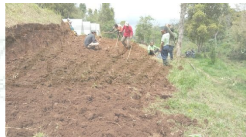
Gambar 2. Pemerataan Lahan untuk Pemasangan Panel Surya

Setelah kegiatan survey untuk titik pemasangan lampu panel surya pada wisata camping ground , maka dilakukan pemerataan lahan dapat dilihat pada Gambar 2, pemerataan ini dilakukan agar pondasi panel surya dapat dibangun dengan baik dan tidak mudah roboh.