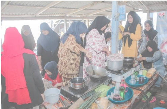
Gambar 3. Istri-istri nelayan sebagai peserta melakukan praktikum mengolah ikan dan rumput laut

Pada sesi awal dan akhir pelatihan tim pengabdian melakukan survei dengan menyebarkan kuesioner yang berisikan mengenai tingkat pemahaman terhadap pengetahuan dan pemahaman peserta terhadap materi yang disampaikan dalam pelatihan. Tabel 1 menunjukkan bahwa sebagian besar peserta telah mengalami kemajuan yang baik dengan memahami materi yang diberikan dalam pelatihan. Selain itu dilakukannya survei mengenai pengalaman dan kepuasan para istri nelayan yang telah mengikuti pelatihan. Hal ini dilakukan sebagai bahan evaluasi tentang pengabdian yang telah dilakukan