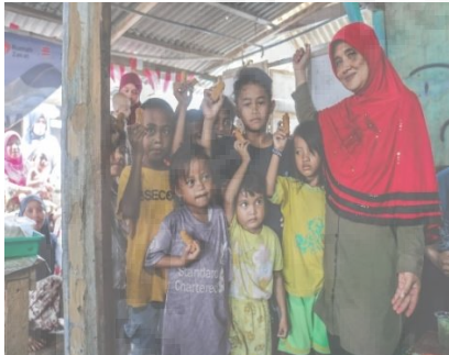
Gambar 4. Pembagian hasil olahan kepada anak-anak nelayan kelurahan keteguhan

hari. Hasil evaluasi juga didapatkan berdasarkan pengawasan oleh tim pengabdian yang dilakukan setelah kegiatan pengabdian selesai dengan cara memantau perkembangan pembuatan olahan ikan di rumah masing-masing keluarga nelayan menunjukkan bahwa para peserta telah mengimplementasikan pelatihan dengan baik karena terbukti istri-istri nelayan memasak berbagai olahan ikan di rumah untuk dikonsumsi bersama keluarga.