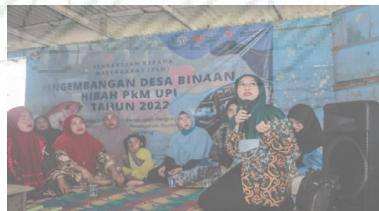
Gambar 2. Penyampain materi pemenuhan gizi seimbang

Respon peserta pada saat pelatihan yaitu sangat antusias karena materi praktik yang diberikan belum pernah diterima dan belum pernah ada pelatihan mengenai pembuatan olahan ikan. Situasi proses pelatihan saat penyampaian materi hingga demonstrasi sangat kondusif dan interaktif. Peserta memperhatikan dengan baik materi yang diberikan. Suasana pelatihan dibangun melalui sistem diskusi dua arah antara peserta dan pemateri sehingga materi yang kurang dipahami peserta dapat di diskusikan. Sehingga kegembiraan peserta nampak pada proses penyampaian materi selain itu hal ini terjadi karena kegiatan pelatihan yang diselenggarakan merupakan kegiatan pelatihan pertama kali di kelurahan tersebut saat adanya pandemi Covid-19 yang mewabah di Bandar Lampung. Produk jadi yang dihasilkan adalah nugget ikan dan es rumput laut yang merupakan diversifikasi produk yang sangat digemari oleh peserta karena produk ini belum diketahui dan dipraktikan sehingga sangat menginspirasi peserta untuk melakukan usaha dengan membuat dan menjualnya. Selain itu produk olahan ikan yang berupa nugget ikan dan es rumput laut ini dibagikan kepada para anak-anak disekitar tempat pelaksanaan pelatihan di Desa Nelayan Kelurahan Keteguhan.