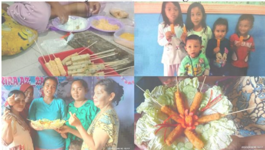
Gambar 5. Pembuatan olahan ikan oleh istri-istri nelayan kelurahan keteguhan untuk konsumsi rumah tangga