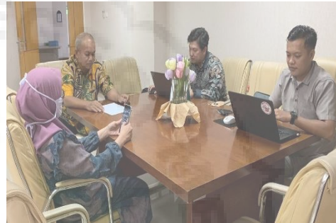
Gambar 4. Diskusi Tim Untuk Finalisasi Design.

Pada tanggal 07 April 2022, tim melakukan diskusi tentang rencana sosialisasi pembuatan Dodol nanas dan teknik pemasaran dan finalisasi design, alat dan bahan terhadap produk yang akan dibuat yakni Alat pengaduk dodol nanas otomatis.