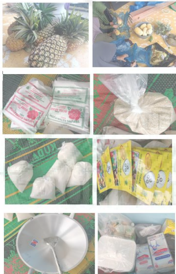
Gambar 11. Alat Dan Bahan Pembuatan Dodol Nanas Pada Kegiatan Persiapan Alat Bahan Di Sosialisasikan Bahwa Teknik Pembuatan Adonan Dodol Memiliki Takaran Tertentu Untuk Menciptakan Cita Rasa Yang Alami. Mitra Dan Masyarakat Langsung Mencobakan Dalam Membuat Takaran Setiap Bahan.

Pada tanggal 02 Agustus 2022, tim bersama dengan mahasiswa melakukan sosialisasi penggunaan alat pengaduk dodol otomatis sekaligus menguji coba pembuatan dodol bersama dengan mitra dan perwakilan masyarakat. Kegiatan pertama yakni mempersiapkan alat dan bahan.