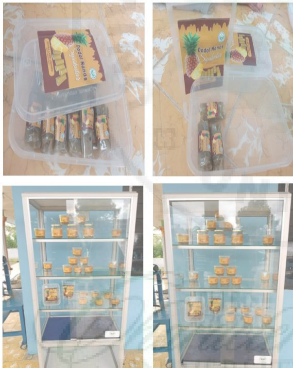
Gambar 15. Packaging Dodol Nanas Sipahutar.

Adapun hasil kemasan dua model packaging dodol nanas Sipahutar sebagai berikut ;