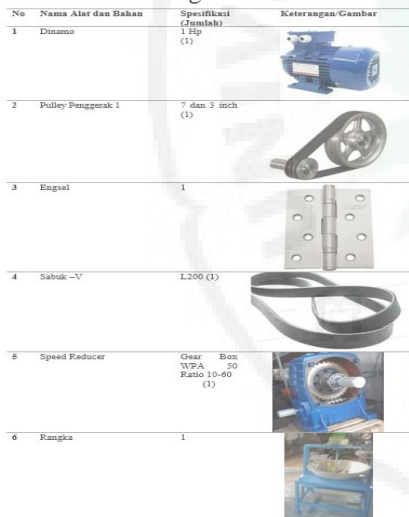
Tabel 2. Spesikasi Alat dan Bahan Pembuatan Alat Pengaduk Dodol Otomatis.

Setelah selesai sosialisasi tahapan selanjutnya mengumpulkan alat dan bahan untuk mengerjakan produk olahan dodol nanas dengan menerapkan teknologi tetap guna (TTG). Adapun alat dan bahan yang dipersiapkan sebelum memulai proses pembuatan Alat dapat di lihat pada tabel 2.