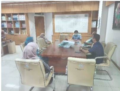
Gambar 10. Diskusi Tim Untuk Persiapan Sosialisasi Alat Dan Teknik Packaging Ke Mitra.

Setelah selesai semua alat pengaduk dodol otomatis dan rancangan packaging, selanjutnya tim melaksanakan diskusi untuk mengadakan sosialisasi ke mitra.