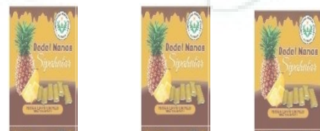
Gambar 8. Stiker untuk pembungkus dodol Adapun rancangan packaging yang dibuat adalah dalam beberapa kemasan, yakni sebagai berikut;

Adapun nama/label produk yang dibuat dalam pengolahan dodol nanas adalah “Dodol Nanas Sipahutar”. Label akan dibuat dalam bentuk stiker yang akan di tempelkan dalam kemasan, baik kemasan pembungkus dodol maupun di packaging ;