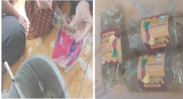
Gambar 14. Proses Packaging Kemasan Dodol.

tentunya dodol dikemas dalam plastik transparan dengan massa 1 ons kemudian di beri stiker sebagai berikut;