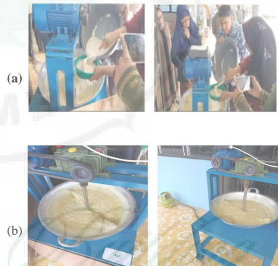
Gambar 13. (a) dan (b) Mitra Antusias Memasak Dodol Nanas Menggunakan Alat Pengaduk Otomatis.

Kegiatan selanjutnya yaitu memasak adonan dodol nanas dengan menggunakan alat pengaduk otomatis. Sebelum menggunakan alat, masyarakat dan mitra tentunya terlebih dahulu di sosialisasikan cara pemakaian dan pemeliharaan alat. Tim bersama dengan mahasiswa melakukan pendampingan dalam penggunaan alat dimulai dari pengenalan komponen dan fungsi setiap komponen alat, kemudian cara memulai (start) dan memberhentikan (stop) serta bagaimana cara pemeliharaan alat agar bisa tetap awet.