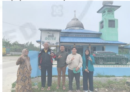
Gambar 5. Tim Bersama Mahasiswa Foto Bersama Di Lokasi Mitra.

Pada tanggal 21-22 Mei 2022, tim bersama mahasiswa berkunjung ke tempat mitra untuk mengadakan sosialisasi pengolahan dodol nanas untuk mendapatkan cita rasa nikmat dan alami serta strategi marketing. Mesjid Ad-Da'wah Desa Sipahutar I merupakan tempat lokasi sosialisasi bersama mitra dan beberapa perwakilan masyarakat.