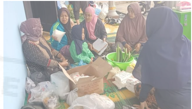
Gambar 12. Mitra dan Masyarakat Terlihat Antusias pada Kegiatan Sosialisasi.

Kegiatan selanjutnya yaitu memasak adonan dodol nanas dengan menggunakan alat pengaduk otomatis. Sebelum menggunakan alat, masyarakat dan mitra tentunya terlebih dahulu di sosialisasikan cara pemakaian dan pemeliharaan alat. Tim bersama dengan mahasiswa melakukan pendampingan dalam penggunaan alat dimulai dari pengenalan komponen dan fungsi setiap komponen alat, kemudian cara memulai (start) dan memberhentikan (stop) serta bagaimana cara pemeliharaan alat agar bisa tetap awet.