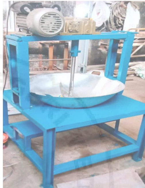
Gambar 7. Alat Pengaduk Otomatis Dodol Nanas.

Perakitan dimulai pada tanggal 06 Juni 2022 dan selesai pada tanggal 29 Juni 2022 dengan kondisi baik dan semua rangkaian alat dan bahan bisa berfungsi dengan baik. Adapun hasil alat pengaduk dodol nanas sebagai berikut;