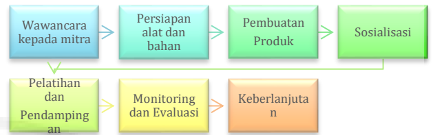
Gambar 2. Tahapan Kegiatan PKM.

Berdasarkan permasalahan yang telah dikemukakan, maka kegiatan PKM dilakukan dengan tahapan sebagai berikut.