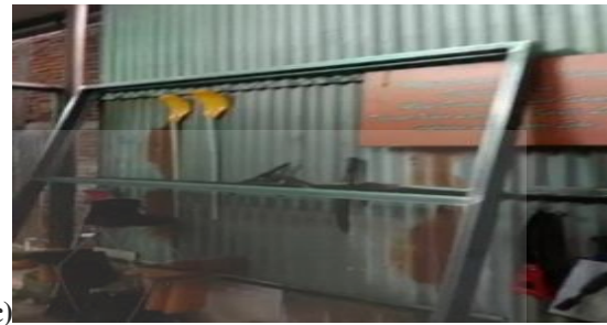
Gambar 4. Proses Desain 3D Map Guide . a) Proses Desain 3D untuk Website , b) Proses Desain 3D untuk Map Guide , dan c) Proses Pembuatan Rangka Map Guide .