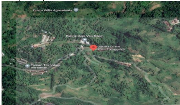
Gambar 1. Peta Lokasi Agrowisata Dilem Wilis.

peta lokasi dari Agrowisata Dilem Wilis yang ditunjukkan pada Gambar 1.