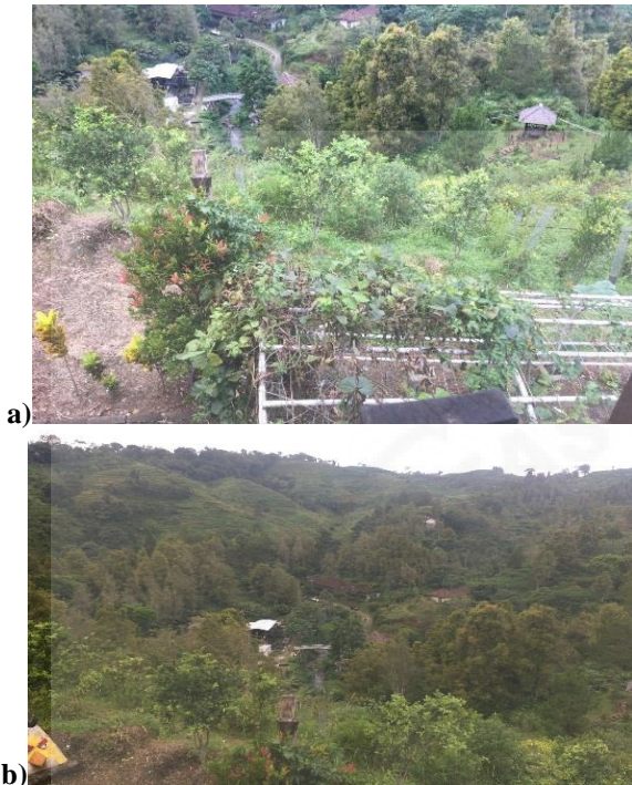
Gambar 3. Survei Lokasi Agrowisata Dilem Wilis. a) Pemandangan Dilem Wilis dari Gerdu Pandang dan b) Pemandangan Dilem Wilis dari Taman Atsiri.

Setelah melakukan kegiatan survei, dilakukan perencanaan program dengan melakukan pembuatan desain 3D untuk pemetaan Agrowisata Dilem Wilis dan pembuatan penunjuk arah sebagai upaya untuk memberikan informasi dan memperkenalkan Agrowisata Dilem Wilis kepada pengunjung yang masih awam ditambah dengan luasnya lokasi Agrowisata tersebut. Pada Gambar 4 dan Gambar 5 menunjukkan proses desain 3D map guide dan proses pembuatan penunjuk arah. Penunjuk arah memberikan peran dalam penyampaian informasi arah maupun tujuan melalui media visual (Purwita & Yasa, 2019).