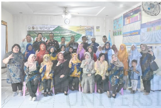
Gambar 11 Kegiatan Dokumentasi Bersama.

Tindak lanjut program dilakukan untuk melihat keberlanjutan program dengan mengembangkan konsep paket wisata inovatif lainnya.