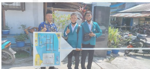
Gambar 6. Pemberian Fasilitas Map Destinasi Wisata Kepada Pihak Desa.

Kegiatan dilanjutkan dengan merangkum semua potensi desa tersebut menjadi sebuah buku saku yang nantinya dapat menjadi referensi masyarakat yang datang ke Desa Pematang Johar. Pengabdian ini juga merancang sebuah pojok informasi yang dikemas dengan konsep literasi sehingga nantinya dapat menjadi pusat informasi bagi para pengunjung.