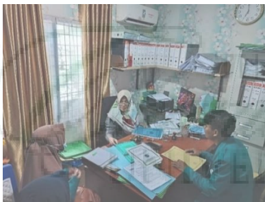
Gambar 3. Diskusi Bersama Sekdes Mengenai Pelaksanaan Observasi.

Kegiatan awal dilakukan dengan melakukan koordinasi dengan pihak pemerintah desa untuk memetakan beberapa potensi desa yang dapat dijadikan sebagai destinasi wisata. Berdasarkan informasi dari Kepala Desa Pematang Johar terdapat beberapa destinasi diantaranya: