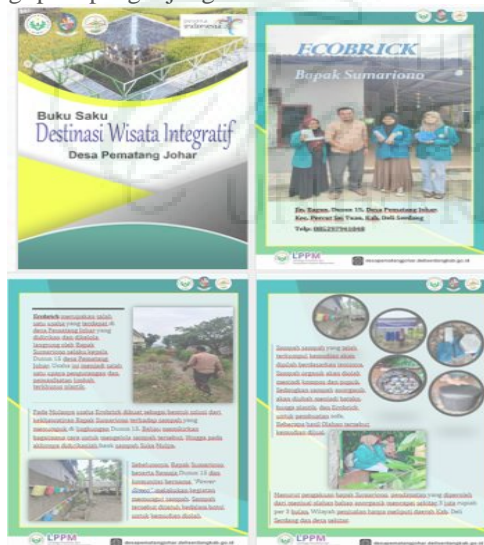
Gambar 7. Buku Saku Destinasi Wisata di Desa Pematang Johar.

Kegiatan dilanjutkan dengan merangkum semua potensi desa tersebut menjadi sebuah buku saku yang nantinya dapat menjadi referensi masyarakat yang datang ke Desa Pematang Johar. Pengabdian ini juga merancang sebuah pojok informasi yang dikemas dengan konsep literasi sehingga nantinya dapat menjadi pusat informasi bagi para pengunjung.