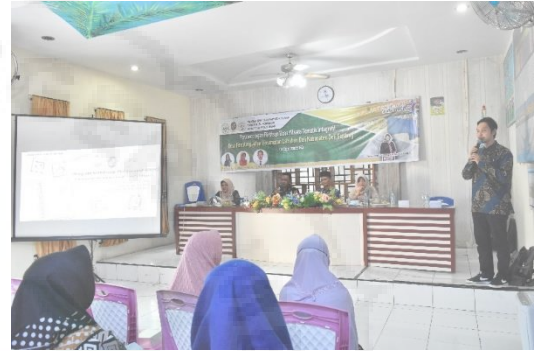
Gambar 8. Penyampaian Materi Mengenai Fasilitas Informasi Wisata Yang Dibuat Oleh Tim Pengabdian.

Kegiatan selanjutnya merupakan kegiatan Pendampingan dan Sosialisasi mengenai Rintisan Desa Wisata Tematik Integratif. Kegiatan dimulai dengan menyampaikan informasi mengenai beberapa media informasi yang dirancang oleh Tim Pengabdian sebagai pusat informasi bagi para wisatawan nantinya.