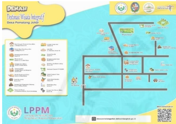
Gambar 5. Desain Plank Map Destinasi Wisata.

berkunjung ke Desa Pematang Johar. Plank Map disertai dengan barcode yang nantinya akan terintegrasi dengan buku saku mengenai deskripsi potensi desa yang nantinya juga dapat digunakan sebagai media informasi wisatawan.