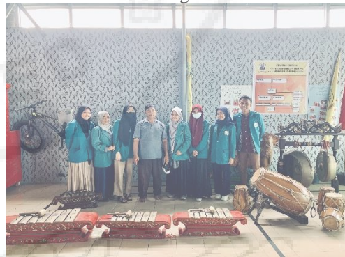
Gambar 2. Sanggar Seni Sebagai Potensi Desa Pematang Johar.