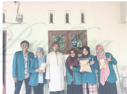
Gambar 4. Observasi Kepada Salah Satu Masyarakat Kreatif Yang Berpotensi Dikembangkan Sebagai Destinasi Wisata.

Setelah melaksanakan koordinasi Tim Pengabdian melakukan observasi untuk menggali informasi mengenai potensi desa dan nantinya akan dideskripsikan kedalam buku saku integratif. Tim Pengabdian melibatkan mahasiswa PGSD FIP UNIMED untuk melakukan wawancara sehingga informasi yang didapat dapat lebih optimal. Berikut beberapa dokumentasi mengenai observasi yang dilakukan oleh Tim Pengabdian.