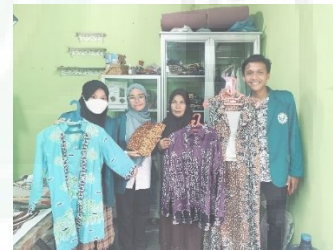
Gambar 1. Batik Menjadi Potensi Desa Pematang Johar.

Pelaksanaan Program Kemitraan Masyarakat ini berbentuk pendampingan mengenai pengembangan desa wisata tematik integratif yang melibatkan 19 perwakilan kelompok masyarakat yang berpotensi dikembangkan menjadi destinasi wisata terintegrasi di Desa Pematang Johar. Tujuan dari Program Kemitraan Masyarakat ini adalah mencoba mengkolaborasi berbagai potensi masyarakat untuk dapat diintegrasikan dalam sebuah manajemen wisata yang baik sehingga berimbas pada peningkatan perekonomian masyarakat setempat.