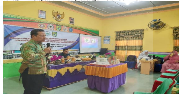
Gambar 3. Pendampingan Tata Kelola Perpustakaan Desa Ara Payung Sebagai Pusat Kegiatan Literasi.

Gambaran umum pelaksanaan kegiatan pada tahap ini dapat dilihat pada gambar berikut.