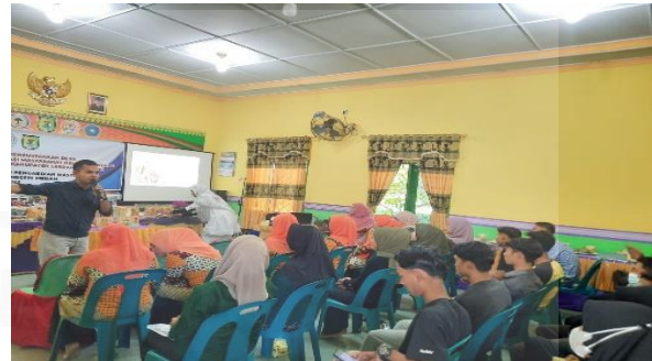
Gambar 2. Pendampingan Grand Design Desa Literasi Berbasis Masyarakat.

Gambaran sederhana pendampingan grand desain desa literasi berbasis masyarakat oleh tim PKM LPPM UNIMED dapat dilihat pada gambar berikut.