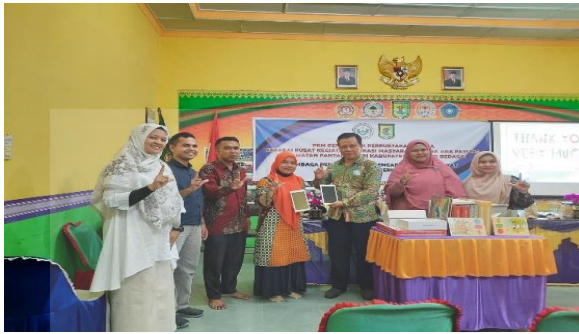
Gambar 4. Penyerahan Alat Kepada Mitra.