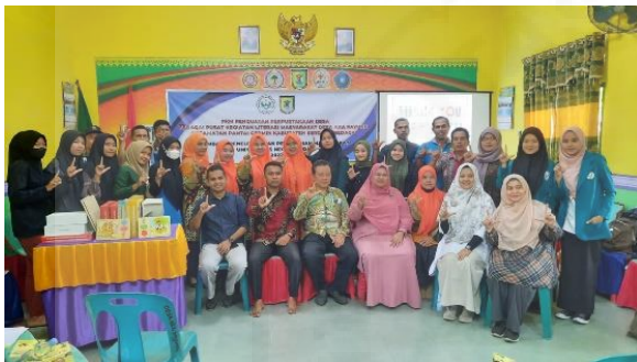
Gambar 5. Foto Bersama Di Akhir Acara.