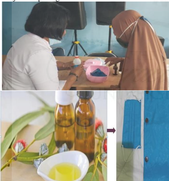
Gambar 2. Hasil Pengabdian.

Pengabdian ini telah menghasilkan 20 masker dan 4 sarung bantal beraroma erapi yang nyaman dipakai dan melegakan pernafasan sebagaimana ditunjukkan pada gambar berikut :