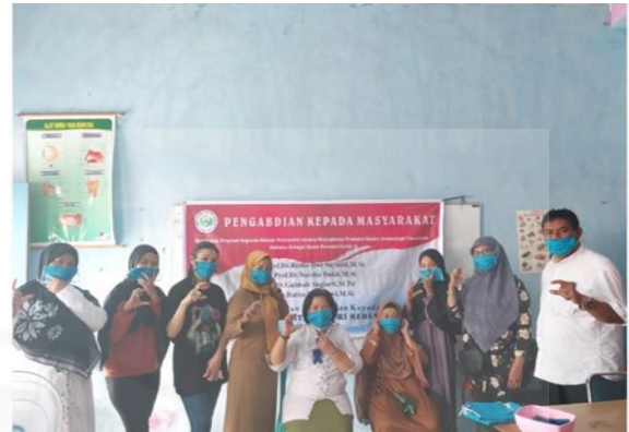
Gambar 3. Foto Bersama.

Pada pengabdian ini digunakan 100 ML minyak eucalyptus bibit dengan pelarut alkohol teknis sehingga konsentrasi 20% b/v. Lama waktu maserasi 24 jam waktu optimum. Menurut konsumen pengguna masker yang digunakan nyaman dan wanginya awet diprediksi sampai 3 bulan.