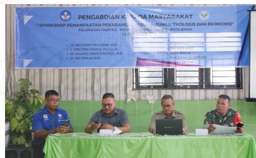
Gambar 2. Pembukaan Workshop

Kegiatan workshop pemanfaatan pekarangan bernilai ekologis, ekonomis dan bergizi berbasis hidroponik ini dilaksanakan pada tanggal 22 Juli 2022 di aula kelurahan Nangka Kecamatan Binjai Utara. Kegiatan ini diikuti oleh warga masyarakat yang mewakili masing-masing dusun/lingkungan di wilayah kelurahan Nangka. Dari sebanyak 20 orang perwakilan masyarakat yang diundang, yang hadir sebanyak 13 orang dari 5 lingkungan/dusun.