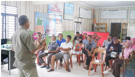
Gambar 3. Pelatihan Merancang Hidroponik

Penyuluhan tentang pemanfaatan pekarangan rumah yang bernilai ekologis, ekonomis dan bergizi disampaikan diawal dengan tujuan untuk memberikan wawasan pengetahuan kepada masyarakat tentang arti pentingnya pekarangan rumah guna mensuplai kebutuhan pangan dan gizi keluarga. Melalui pemanfaatan pekarangan yang optimal akan berdampak pada pemeliharaan fungsi ekologis baik sebagai catchment area maupun sebagai sumber penghasil oksigen. Sesi pelatihan rancang bangun perangkat hidroponik bertujuan untuk memberikan keterampilan pada masyarakat tentang bagaimana merancang dan membuat perangkat hidroponik sebagai media tanaman yang akan ditempatkan pada pekarangan rumah. Pada sesi ini, peserta sangat antusias mengikuti kegiatan pelatihan dari mulai pengenalan alat dan bahan yang diperlukan, merancang bentuk dan ukuran hidroponik, sampai bagaimana merakit perangkat hidroponik tersebut.