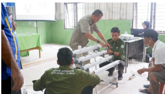
Gambar 4. Merakit Hidroponik

Manfaat dari pelaksanaan kegiatan yang dapat dirasakan oleh masyarakat adalah (a) berupa peningkatan pengetahuan tentang pemanfaatan pekarangan yang berfungsi ekologis, ekonomis dan dapat memenuhi kebutuhan gizi keluarga sebesar 91,70%, (b) keterampilan menanam tanaman berbasis hidroponik sebesar 69,20%, (c) bermanfaat secara ekonomi sebesar 46,20%, dan (d) dapat menyumbang asupan gizi keluarga sebesar 53,80% (Gambar 5). Hal ini sejalan dengan hasil kegiatan PKM Waluyo, 2021 yang menyatakan bahwa terdapat peningkatan