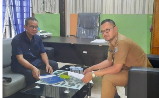
Gambar 1. Koordinasi Rencana Kegiatan

pada tanggal 21 Juni 2022 bertempat di Kantor Kelurahan Nangka-Kecamatan Binjai Utara. Hasil koordinasi dengan pihak Kelurahan Nangka meminta secara khusus untuk mengadakan kegiatan pelatihan tentang budidaya tanaman dengan hidroponik bagi masyarakat di Kelurahan Nangka mengingat wilayah Kelurahan Nangka Sebagian besar rumah masyarakat tidak memiliki lahan pekarangan yang cukup untuk bisa menanam tanaman dalam memenuhi kebutuhan keluarganya.