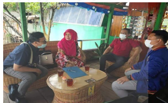
Gambar 3. FGD bersama Bapak Kades, Ketua Karang Taruna Domestik desa Dogang

talenta yang dimiliki, sehingga kesemuanya mempunyai peran dan tanggungjawab dalam melaksanakan sebuah pertunjukan. latihan dilakukan di lapangan tempat mereka selalu berolah seni. Dengan sendirinya keakraban dapat terjalin, dan generasi muda mengetahui budaya yang mereka miliki, kehidupan social, dan budaya yang mereka miliki. Hal ini juga yang menjadi materi pada sebagai kelompok komunitas anak-anak muda di bawah naungan lembaga rumah kreasi desa Dogang untuk beraktifitas, bersama TIM pengembangan dari LPPM membuat Seni Pertunjukan