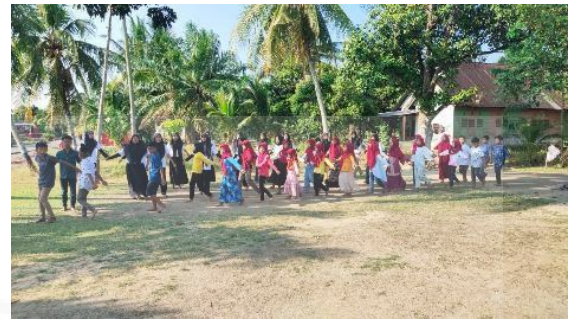
Gambar 8 Glagy Bersih

Glagy Bersih: Glagy bersih dilakukan pada menjelang hari pementasan, atau 1 hari pementasan. Glagy bersih juga menjadibagian dari evaluasi keterlaksanaan pertunjukan pada hari H.