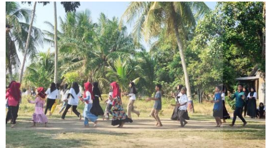
Gambar 2. Latihan Tari di lapangan

desa Dogang secara nyata. Sehingga generasi muda di desa Dogang akan merasa memiliki, dan mengetahui bagaimana proses kesinambungan sebuah budaya. Selain generasi muda di desa Dogang terutama anak-anak akan mencintai budayanya karena telah diperkenalkan sejak dini.