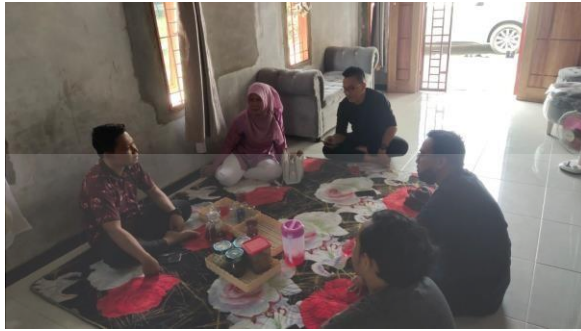
Gambar 4 Pertemuan dengan Ketua Karang Taruna Domestik dan Ketua Rumah Kreasi Desa Dogang