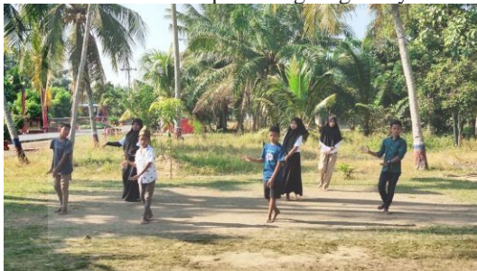
Gambar 7. Latihan penghapalan tari

Latihan lanjutan: pada latihan lanjutan, umumnya sutradara akan mempersiapkan segala sesuatu yang berkaitan dengan pendukung pementasan, yang akan dipakai pada pementasan. Elemen pendukung dalam kelengkapan pertunjukan tersebut antara lain: Property (semua alat yang mendukung peralatan para pemain). dan setting (peralatan yang ditata sesuai naskah dari lakon yang dimainkan, yang memperlihatkan gambaran dari tempat dilangsungkannya cerita)