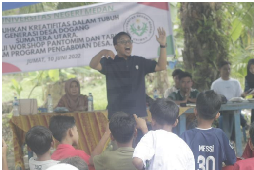
Gambar 6. Latihan penghapalan masing-masing peran

Ketiga metode latihan tadi harus dicoba oleh para pemain dalam proses latihan teater. Bila tidak hingga hendak berkesan main- main saja serta tidak berguna apa- apa. Oleh sebab demikian proses penciptaan teater wajib mengutamakan disiplin yang besar dan keinginan yang keras buat mengarah sukses yang besar.