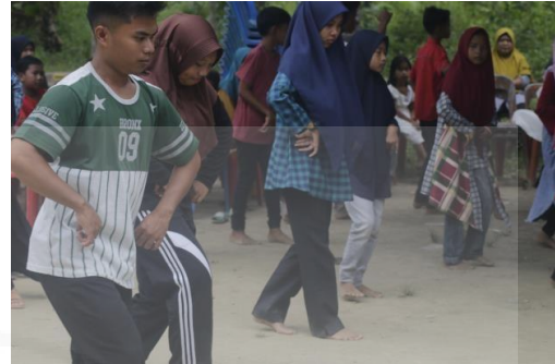
Gambar 5 Pelatihan tari terhadap anak-anak dan remaja

Dalam pemahaman tentang teknik gerak, rasa, dan tempo maka juga diberikan pemahaman tentang , unsur penghayatan, unsur ruang, unsur ria dan busana,, unsur property, unsur musical. Dari pemahaman ini mereka akan memnegmbangkan potensi yang dimiliki, terutama 1) sikap percaya diri, 2) kreatifitas, 3) strategi pengenalan dalam melatih tari 4) membaca dan memanfaatkan peluang untuk mengembangkan seni dalam konteks wisata, 5) mengelola manajemen sanggar, 6) memanfaatkan budaya local sebagai sumber dalam berkarya. Beberapa materi yang dirancang dalam kegiatan pelatihan adalah: eksplorasi, pembentukan, menyusun, evaluasi,